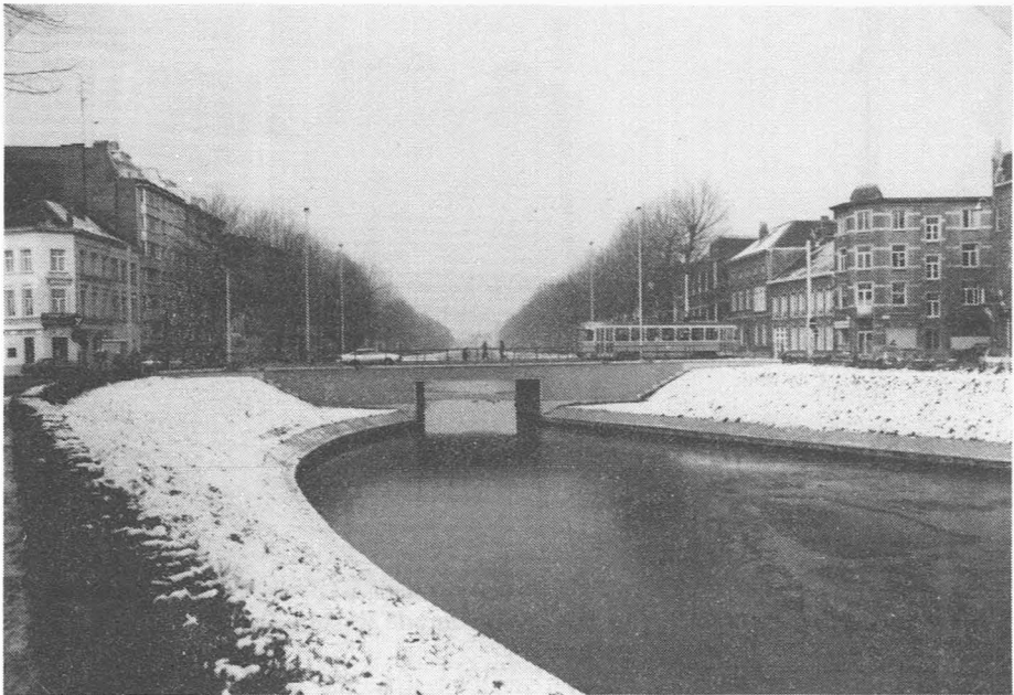
De huidige Rozemarijnbrug (foto winter 1981).