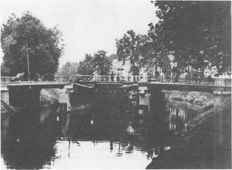
Mei 1940 : de vernielde Rozemarijnbrug.