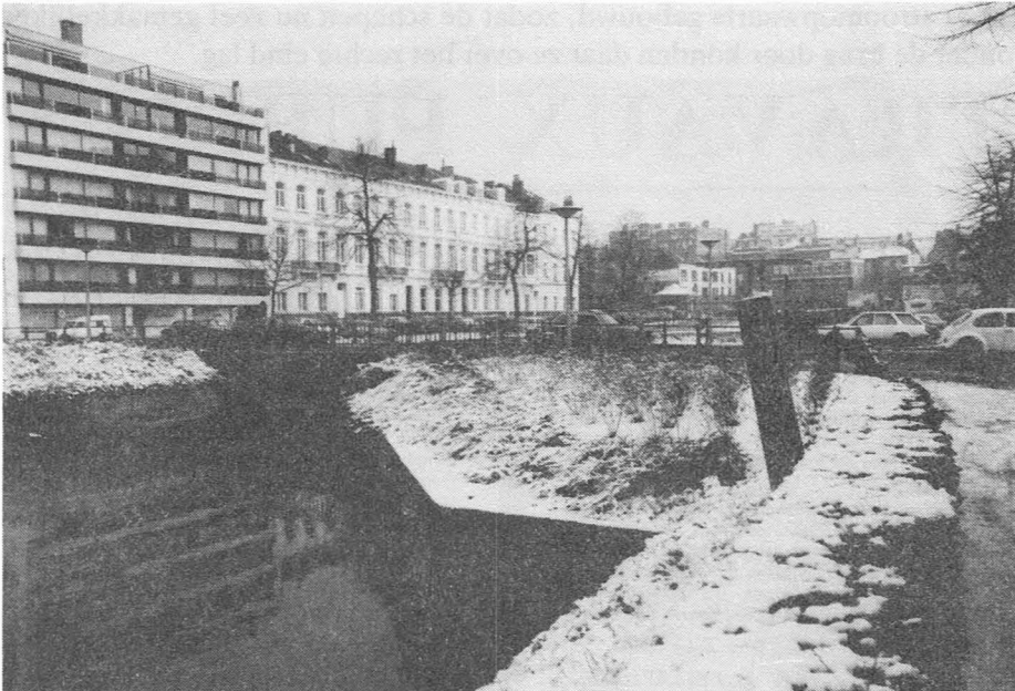
De Hospitaalbrug in 1981, Stadsbrug.

In die tijd (1970) waren er plannen voor een semi-metro in Gent en daarvoor zou men eventueel de Coupure dempen. Omdat men volledig in de onzekerheid verkeerde over de toekomst van de waterloop koos men voor de uitvoering van de brug toch maar voor de zekerheid herbruikbare en opbrekbare materialen : een bruggeraamte in staal en het dek in Azobé-hout (dit is een buitenlandse harde houtsoort welke tegenwoordig veel gebruikt wordt voor brugdekken). Als fundering maakte men gebruik van het versterkte massieve sluishoofd van de vroegere sluis aldaar (zie St.-Agnetebrug). De werken ving aan op 1 december 1971 en werden beëindigd op 23 maart 1972. De brug overspant 13 meter, met een rijweginbreedte van