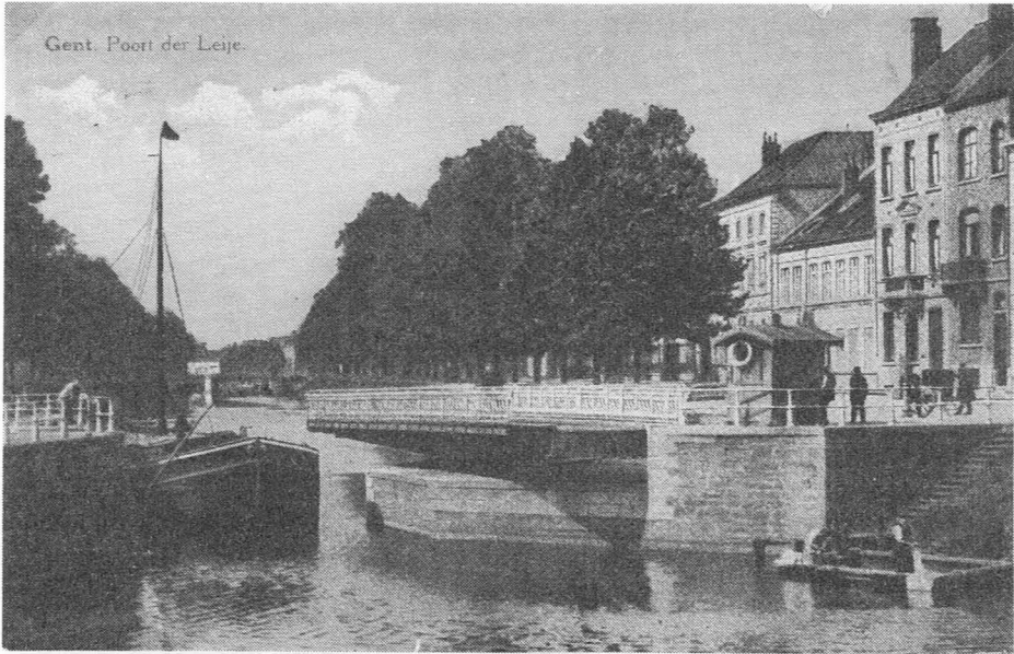
De Rozemarijnbrug anno 1920. Op de achtergrond de Rasp-huisbrug.