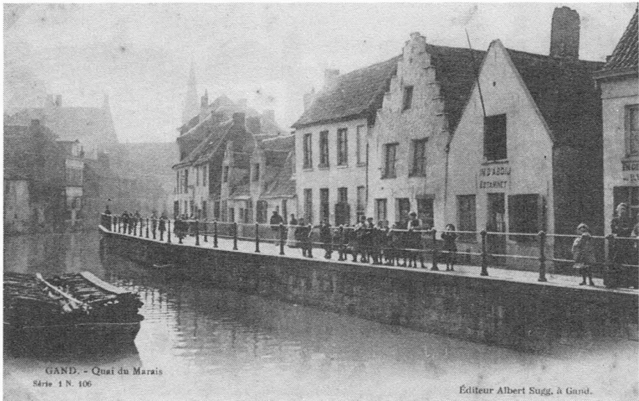
Fig. 1. Het Meerhemvaardeken of Schipgracht omstreeks 1900. Het steegje rechts bestaat nog en geeft uit op een "citeetje". Het heeft geen naam. Om te situeren : de foto werd genomen op het Halsbrekersbrugsken. De toren hoort bij de stadsschool van de Sleepstraat. Het scheepje is geladen met fasselhout of brandhout, gewoonlijk sparhout bestaande uit drie gekloven stukken met bandwissen samengebonden (< Fr. : fascicule of bundel) dat voornamelijk door bakkers gebruikt werd. Dit is ook hier het geval. Het schuitje ligt afgemeerd aan de achterkant van de bakkerij recht over de kerk van het Heilig Kerst in de Sleepstraat. (Prentkaart Albert Sugg serie 1N 106 Gand, Quai du Marais. Verzameling E. Levis) (10).

het gelegen was tussen drie stadspoorten : de Schaaapbrugpoort, de Waterpoort en de Grauwpoort. Wat nogmaals de belangrijkheid van het Sluizenken onderlijnt is het feit dat er in 1837 één van de vier (!) brievenbussen geplaatst werden die Gent rijk was. De bus werd twee maal daags gelicht : om 10 uur 's morgens en om 9 uur 's avonds (4).