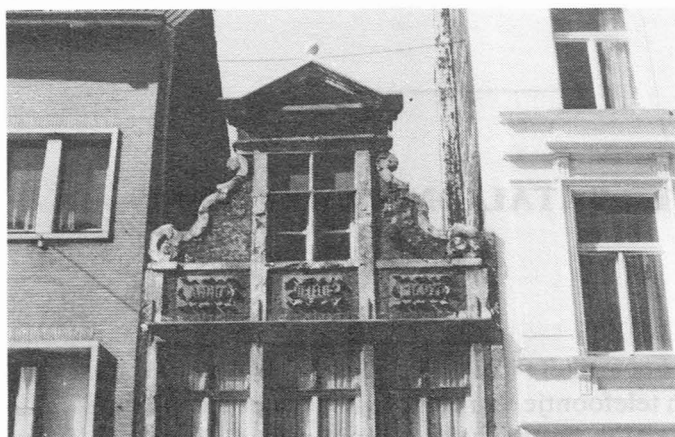
Steendam 49, De lelie.

zien we de benaming en de naam van de winkelier “bij Cant. De Speke”. De druifstak, met links en rechts een blad werd in reliëf uitgebeeld.