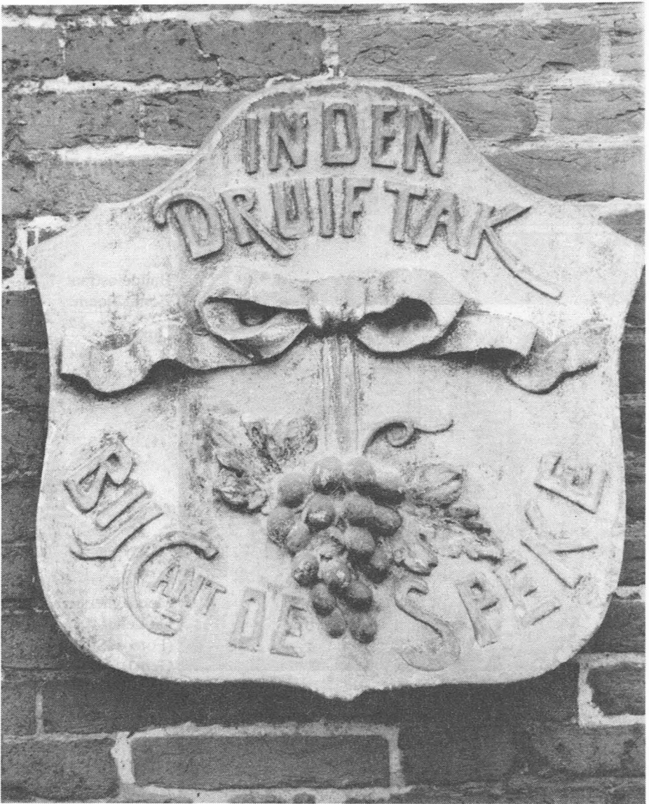
Inden Druiftak. (Museum voor Volkskunde, Gent).