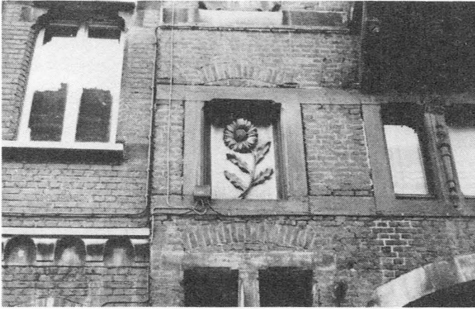
Baudelostraat 7, Zonnebloem.