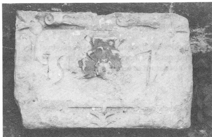
Dubbele roos. (Gents Museum voor Stenen Voorwerpen).