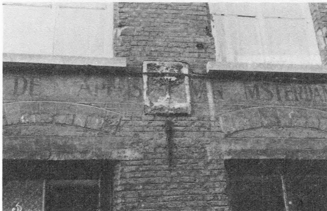
Molenaarstraat 3, Boom.