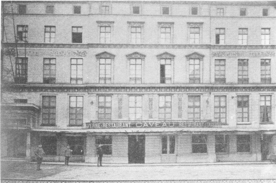
Fig. 1. Het Post-Hotel op de Kouter, waar Dr. Freund in mei 1916 de oorzaak van de typhusbesmetting ontdekte.