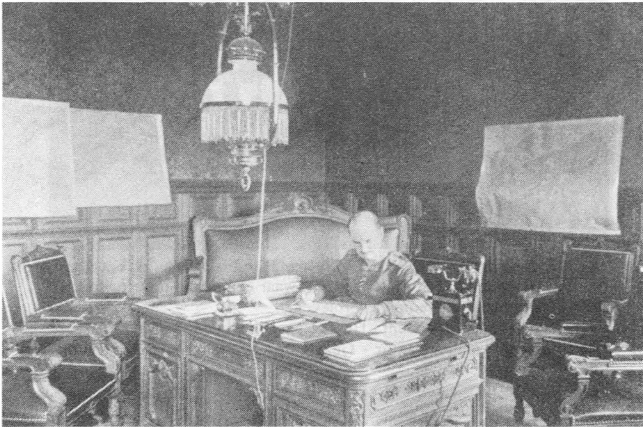
Fig. 2. Oberstleutnant (luitenant-kolonel) Ostertag, chef van de Generale Staf van de Etappen-Inspektie van het 4e leger, eerste dodelijk slachtoffer van de typhusepidemie. (Uit : "Kriegsalbum von Gent - Herausgegeben von der Photographischen Abteilung der Kommandantur - Gent 1916". p. 3, foto 3. Verz. Levis).