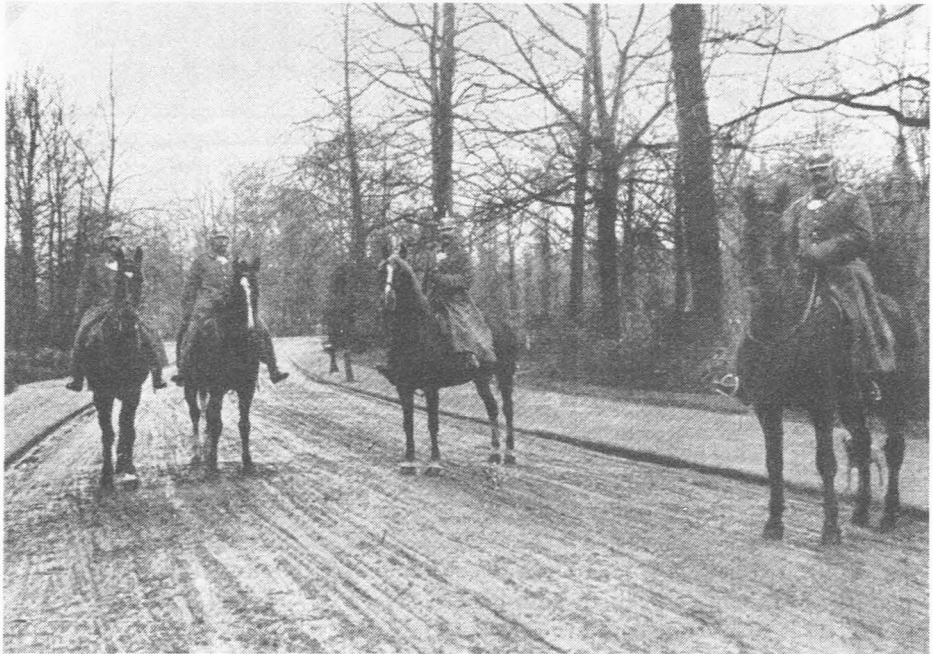
Fig. 3. Gendarmeriepatrouille.

De Duitsers trachtten hun imago wat op te poetsen door aan deze maatregelen een schijn van rechtvaardigheid te geven. Zo werd in de pers aan de lezers voorgehouden dat het oprichten van de Z.A.B.'s slechts ingevoerd was om de Belgische gemeenten te ontlasten van die elementen onder de arbeiders die onrustig en revolutionair werden en om terzelfdertijd de liefdadigheidsinstellingen niet te blijven belasten door het ondersteunen