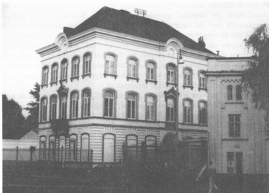
Fig. 6. Wat nog overschiet van “La Linière Gantoise” : de directeurswoning en de ingangspoort. (Thans “Bloedwijn Zuster Godelieve”.) Toestand Juli 1988. Hier werd in de herfst van 1916 de eerste lichte opgeëisten opgesloten. De fabriek was toen nog gelegen aan de nu gedempte Nieuwe Lieve, rechtover de eveneens verdwenen gelijknamige Gantoisebrug.