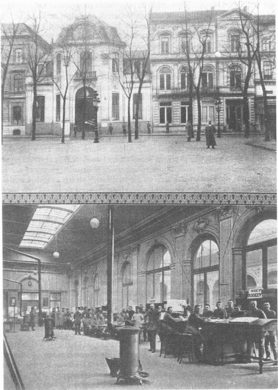
Fig. 4. Meldeamt der Kommandantur in de Beurs op de Kouter te Gent. (Foto 142 blz. 64) boven

onder : idem, binnenzicht van de rechter vleugel (foto 143 blz. 64)