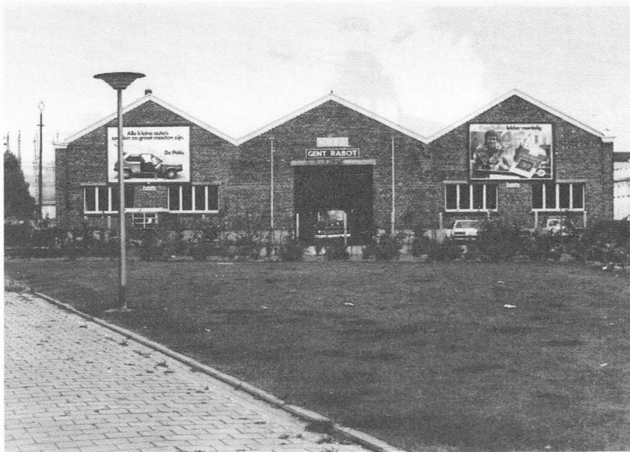
Fig. 7. Het in 1987 afgebroken station van de Ringspoorweg Gent-Rabot, van waaruit het gros van de Gentse opgeëisten vertrokken naar hun respectievelijke plaatsen van dwangarbeid. Zij die in de bijgebouwen van het "Flandria - Palace" opgesloten zaten werden op transport gesteld via het St.-Pietersstation.

Belgische burgers die hen in de weg stonden te ontdoen. Het was een eenvoudige klus de verloofde of echtgenoot van een Gentse schone waarop een wellustig Pruisisch oogje gevallen was, 's nachts van zijn bed te laten halen (4).