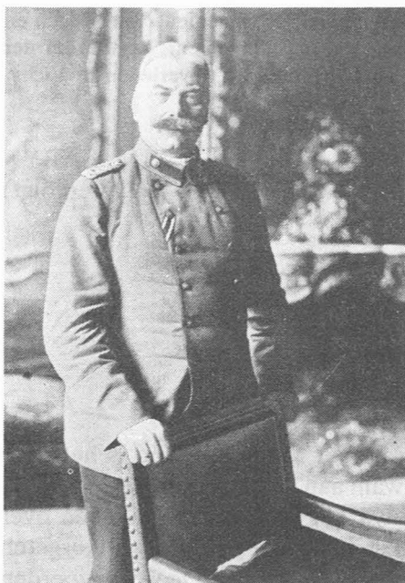
Fig. 1. Oberstleutnant von Wick, kommandant van Gent. (Kriegsalbum von Gent - Herausgegeben von der Photographischen Abteilung der Kommandantur - Gent 1916; foto 137 blz. 60)

een halsdoek, een kostuum of een werkpak, een paar schoenen of kloefen, twee hemden, een paar sokken, een onderbroek, een eetkom, een mes, een vork en twee dekens meebrengen.