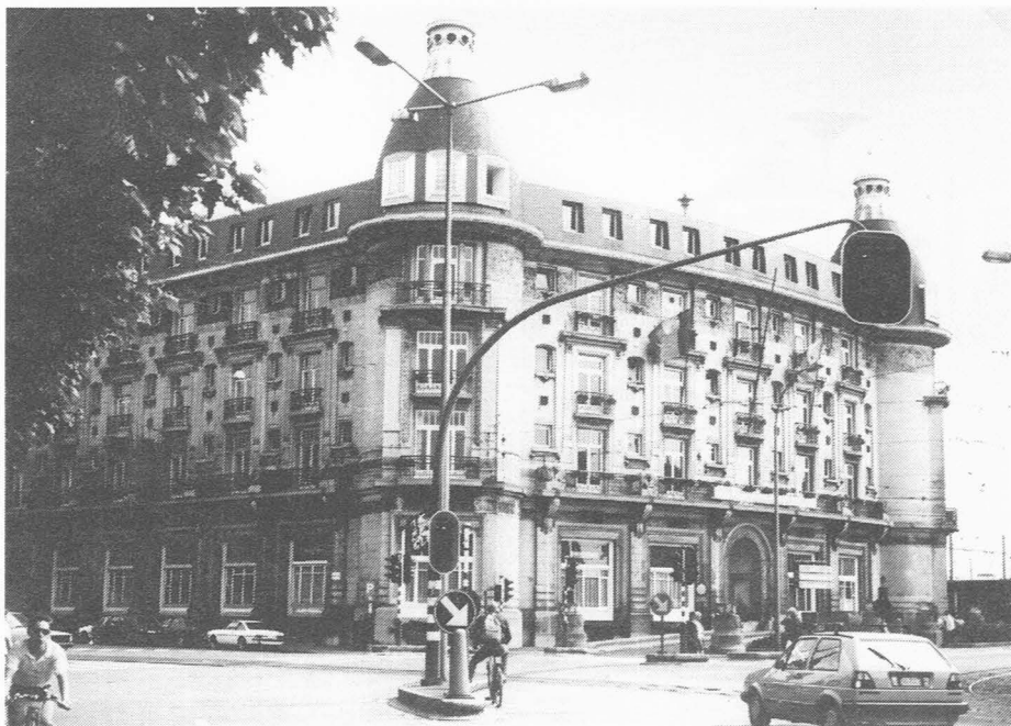
Fig. 12. Het "Flandria - Palace" aan het St.-Pietersstation. Eens het grootste hotel van Gent om de stroom bezoekers van de Wereldtentoonstelling van 1913 te kunnen verwerken. Het had nog een flinke reservevleugel die tijdens de oorlog 1914-1918 als transit gevangenis voor opgeëiste werklieden gebruikt werd. Het hoofdgebouw was toen als Kriegslazarett "Flandria" in gebruik. Thans is er het handelscentrum van de spoorwegen gevestigd.

de Z.A.B.'s vervoerd te worden. Ook op het platteland, in de onmiddellijke omgeving van Gent, was men niet veilig. 's Morgens kwamen vrachtwagens in de stad die van de dorpen terugkeerden waar men ook op mensenjacht geweest was.