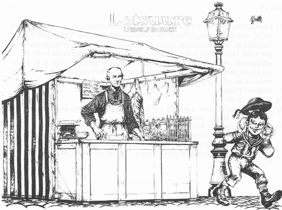
Fig. 9. Caricatuur door Buth - Dagblad “Het Volk”.

Het was een vierkante plaats. “Des vrijdags werd er eene menigte garen uit het heerlijke Vlaemsche vlas gesponnen, te koop gebracht” schreef J.J. Steyaert in 1854. Deze markt werd voor 1404 nog op de Wannekenswaard (Grootkanonplein) gehouden en verhuisde daarna naar het “Plaetseken achter de Vrijdagsmarkt” ook wel kortweg het “Plaetseken” genoemd (4) en later “t Garenplaetseken”. Voorheen stond het bij de Gentenaars bekend als “den Plas” (5) omdat er in het midden een drinkpoel lag met wat groen. Op het panoramisch zicht op Gent van 1534 staat het afgebeeld met een boom en een vijver of plas in het midden. Het is heel oud, misschien wel ouder dan de Vrijdagmarkt zelf. Tot in de dertigerjaren was er in het midden een stemmig plantsoentje aangelegd, behoorlijk wat leuker dan de thans druk gebruikte parkeerplaats. Men kon het Garenplaetseken van af de Vrijdagmarkt in enkele passen via de Waaistraat bereiken. Waaï heeft hier helemaal niets met waaien of wind te maken, maar met “waaï” of “waeÿe” wat drinkpoel of plas betekent en dan weer op het pleintje slaat. Een ander verbindingsstraatje tussen de Garenmarkt en de Vrijdagmarkt was de eerder frivole Garensteeg, het vroegere Engelstraatje (!) waar