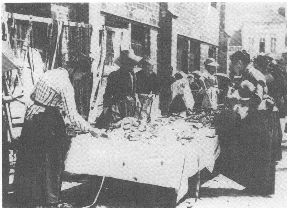
Fig. 4. Vrijdagmarkt te Gent. Een kraam van passementerie (linten, borduurwerk, opstiksels, enz...) tegen het Toreken. Een moeder met kind tast in haar portemonnee. De strohoeden en de parasols wijzen op een zonnig weertje. (foto Fonds Vanderhaegen - Museum voor Volkskunde).

voor 't verhandelen der breede, een uur later voor de smalle stukken. Geen linnen mocht te koop geboden worden dan na door den stadszegelaar voorzien te zijn van het merk, hetwelk den koper eene waarborg was van de degelijkheid des werks. De zegelafels stonden op twee verschillende plaatsen : deze voor de breede lijnwaden tusschen het Toreken en de halve Mane , die voor het smalle goed rechtover den Lijnwaadring . Veel daarbij te parlesanten, kon niet : de tijd was kort, het getal stukken overgroot. De zegelaars, van zessen klaar, lieten den knorrigen wever of koopman maar zijn deuntje afzingen, zonder er acht op te geven, en kweten zich van hunne taak met spoed.