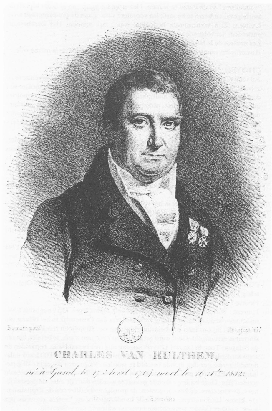
Fig. 5. Lithografie van Baignet.