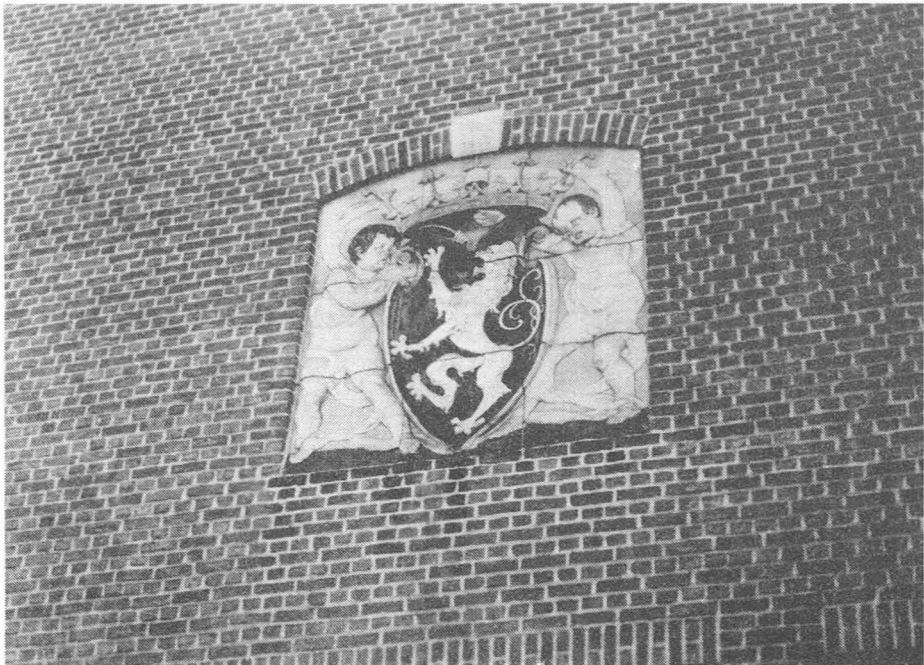
Maaltebruggestraat 131. Gent schild gesteund door twee kinderen.