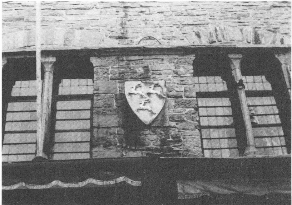
Korenmarkt 5. Drie lopende herten (Borluutsteen).