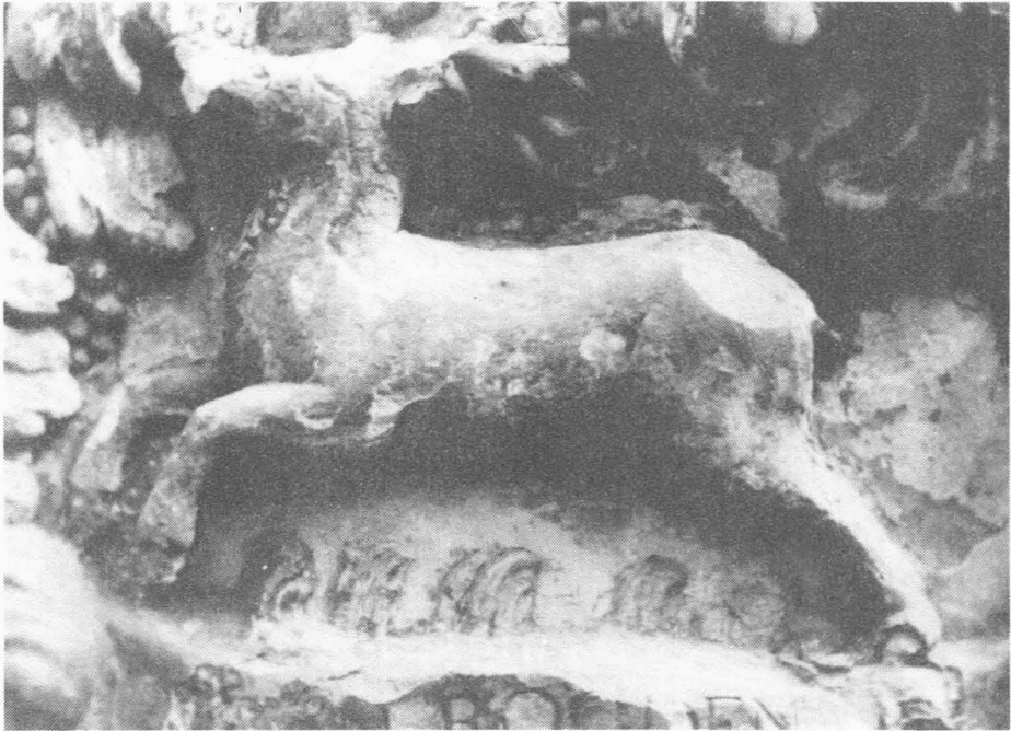
Lange Munt 12. Den rooden hert (1698).