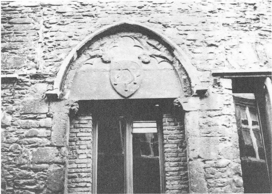
Nederpolder 2. "Den cleenen zickele".