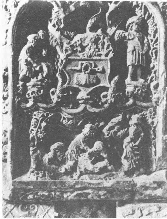
Gevelsteen v. gildehuis (Perceval) der wijnschroeders.

omslagboor boven een vat met een krans. Links tapt de wijnmeter en rechts kondigt de wijnzegger de wijnsoort aan de voorbijgangers aan.