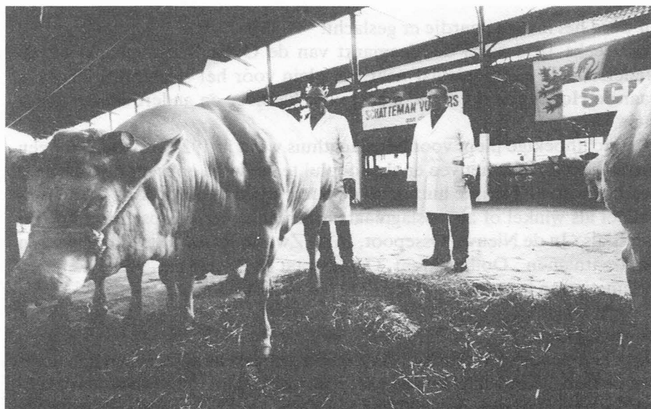
90e en allerlaatste wedstrijd "Vette Os" op de Beestenmarkt voor het slachthuis op 20 maart 1988. Als alles naar wens verloopt verhuizen de dikbillen volgend jaar naar de Groothandelsmarkt. De eretitel "Vette Os" is overigens een twijfelachtige eer want de winnaar wacht hetzelfde lot als de verliezer : het slagersmes...