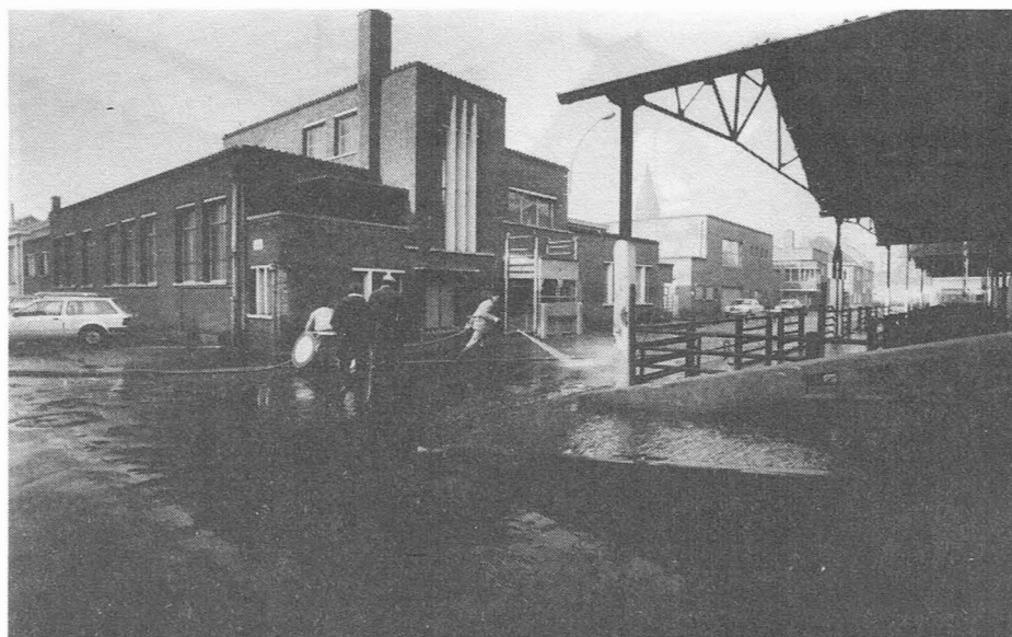
Het Stedelijk slachthuis met overdekte markt. (Foto Michiel Hendryckx. Archief "De Gentenaar" - 24 nov. 1983)