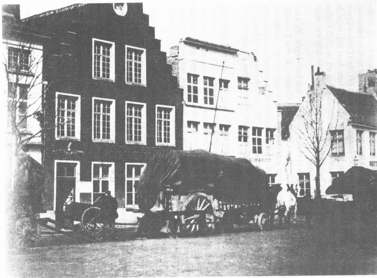
Beestenwagens op de oude Beestenmarkt voor het aanwervingskantoor van het leger in estaminet "De Witte Mauw". Verder de herbergen "Vlasmarkt" en "Rotterdam".