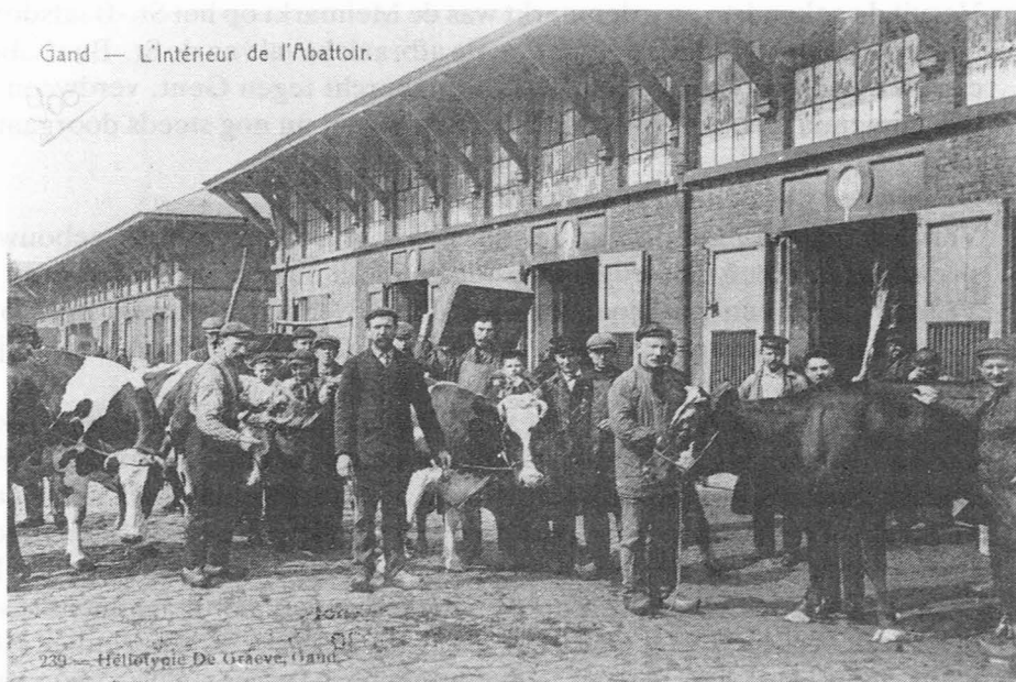
Gand — L'Intérieur de l'Abattoir.

De nog niet overdekte Nieuwe Beestenmarkt in 1902.