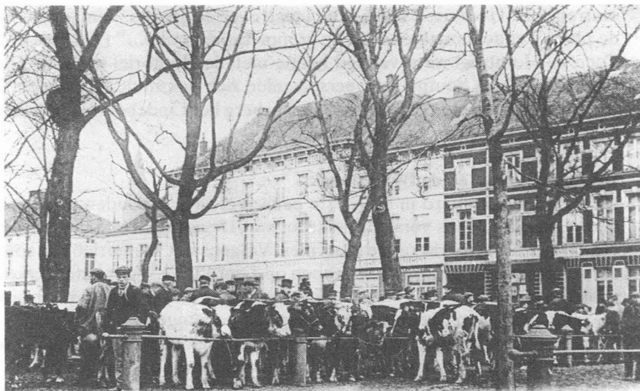
GAND. - Marché au Betail