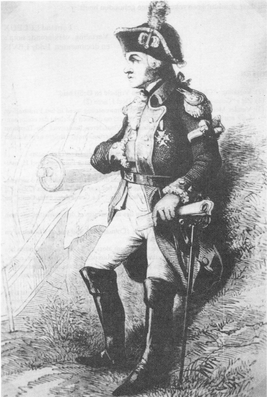
Fig. 6. Generaal Vander Mersch. Meyer nam deel aan een poging om generaal Vander Mersch te bevrijden die sinds 13 april 1790 onder arrest geplaatst was op bevel van het Nationaal Congres.