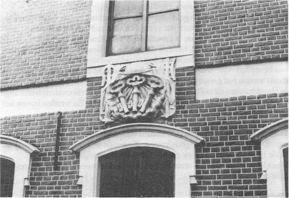
Grauwpoort. De drie Sleutels.