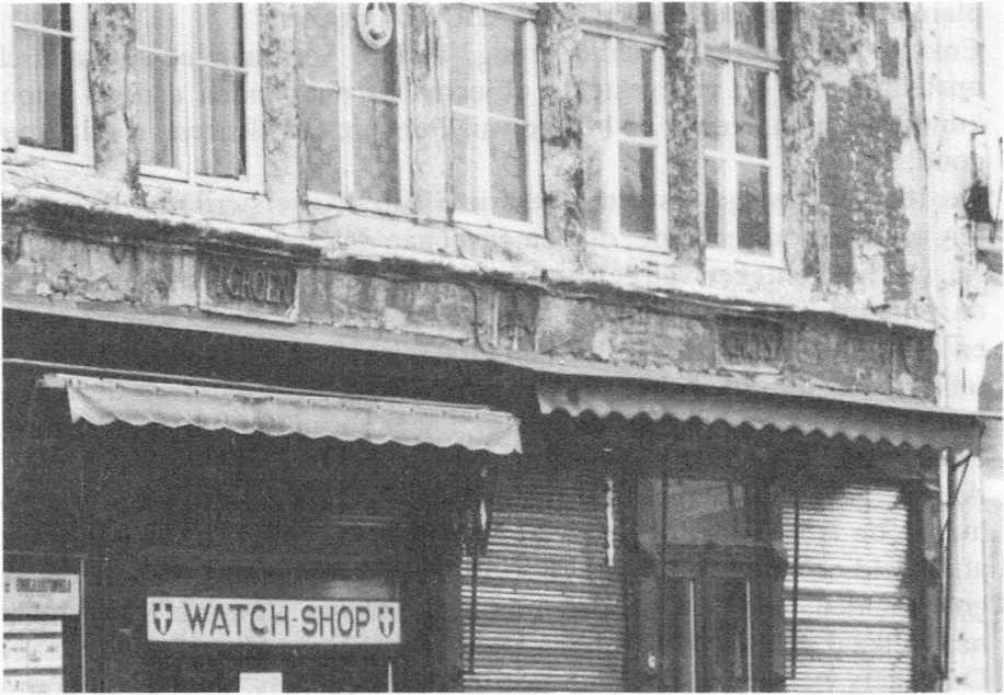
Kleine Vismarkt 4-6 en 8. Tgroen Cruys en Tgauden Hant.