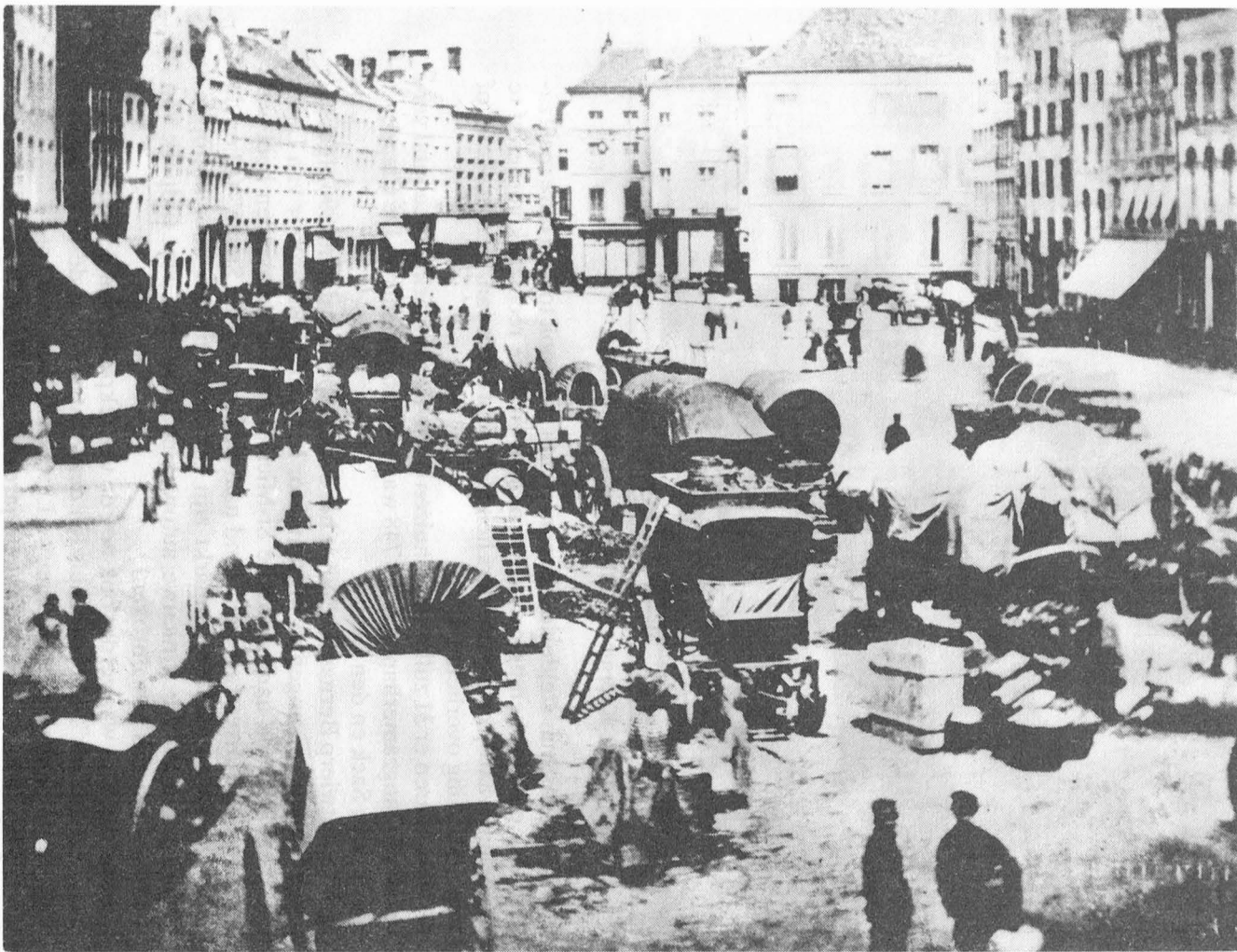
Fig. 1. Koornmarkt Vergroting v.e. stereokaart v.d. Gentse fotograaf Charles D'Hoy. ± 1868. De huifkarren worden geladen.