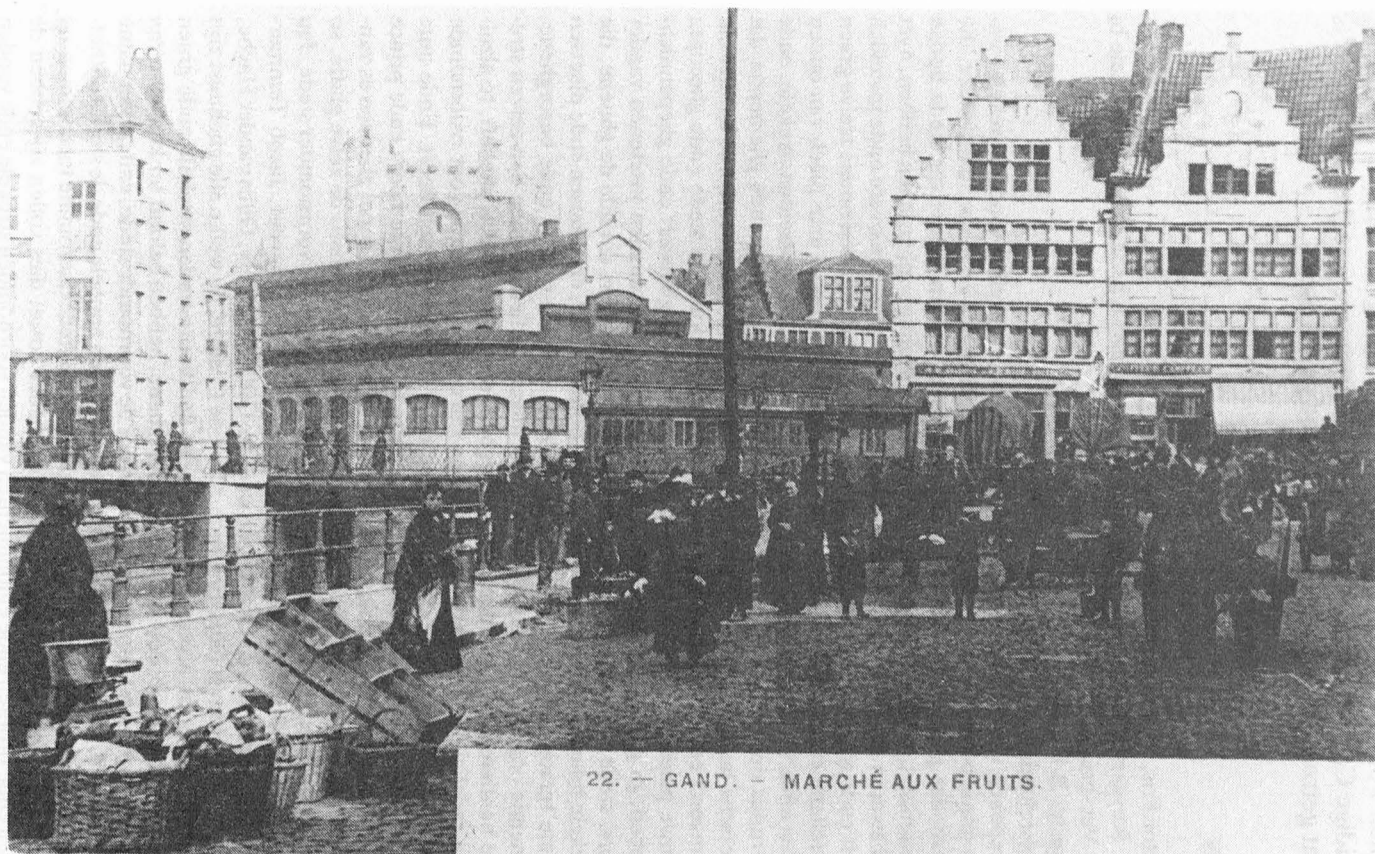
22. — GAND. — MARCHÉ AUX FRUITS.

Fig. 5. Fruitmarkt op de Graslei. Toen men in het begin van deze eeuw de Sterrestraat verbreedde en de St.-Michielsbrug herbouwde, kwam de autoweg Brussel-kust dwars door de fruitmarkt te lopen. Verhuizen was de boodschap.