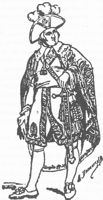
Fig. 4. Lid v.h. “Directoire”.