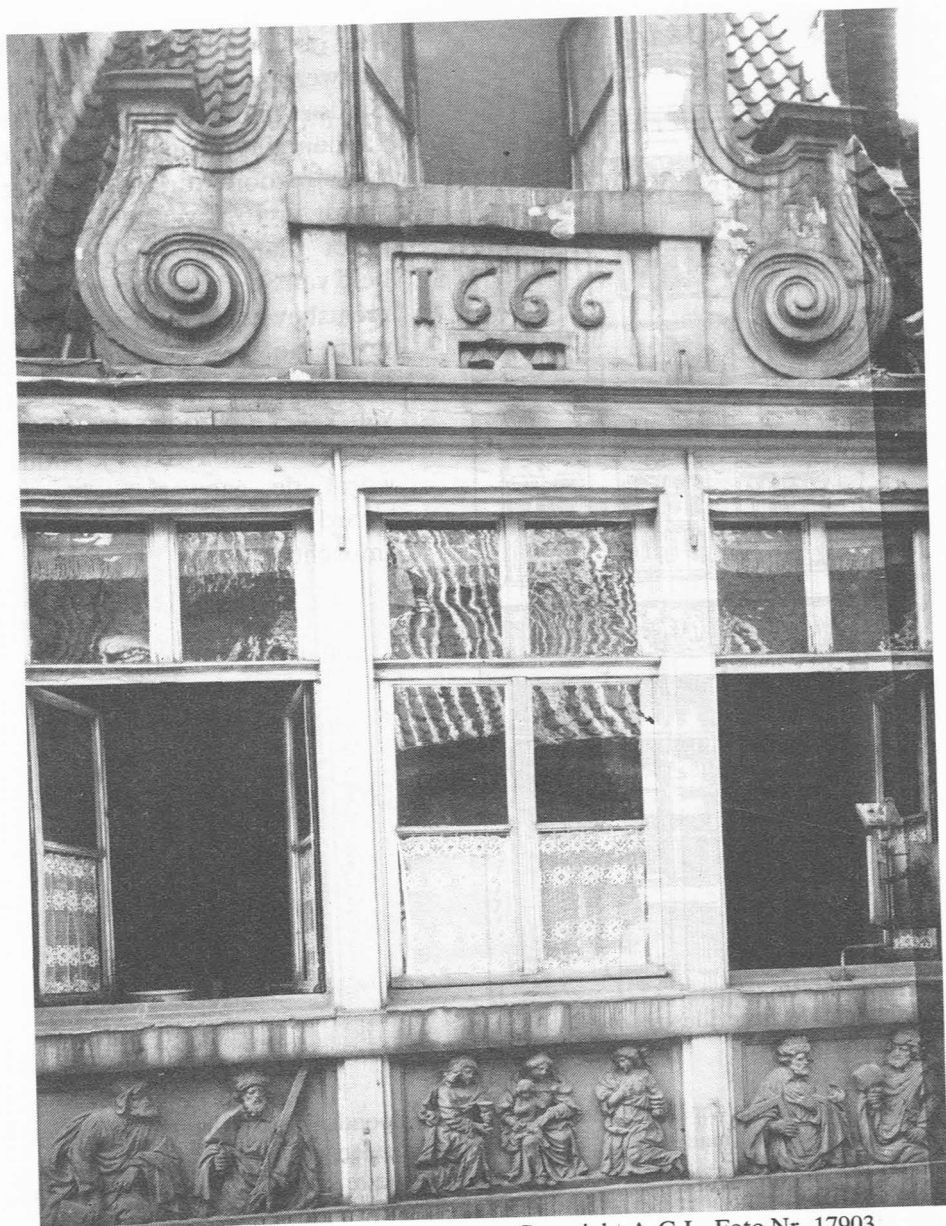
Huis der Vier Gekroonden op de Ketelvest. Foto Nr. 17903.