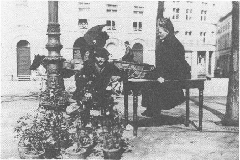
Bloemenstalletje op de Kouter.