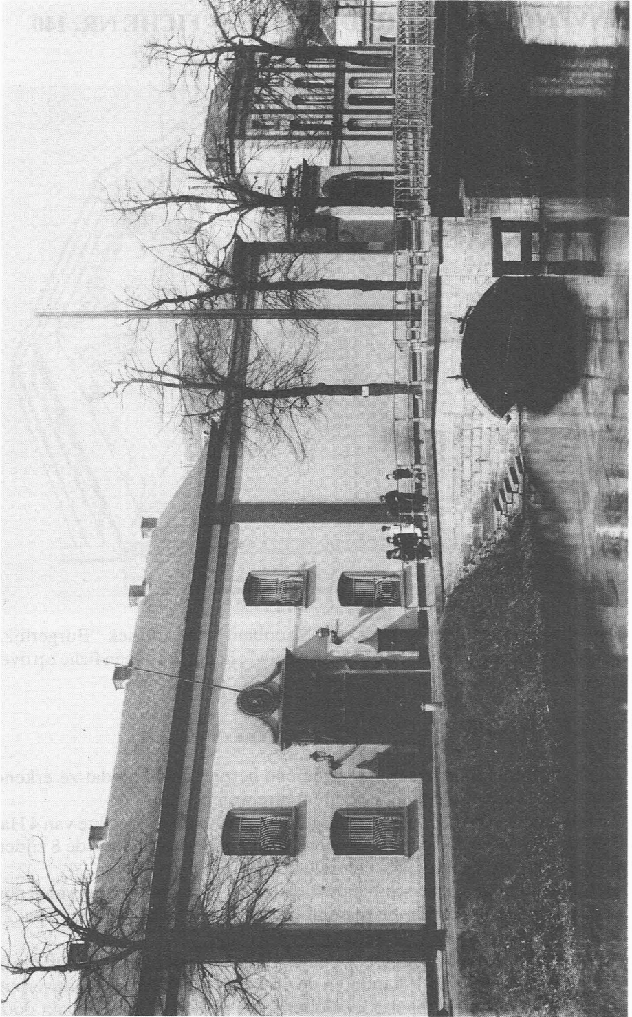
Ingang van het Rasphuis - Foto A.C.L. Nr. 25965.