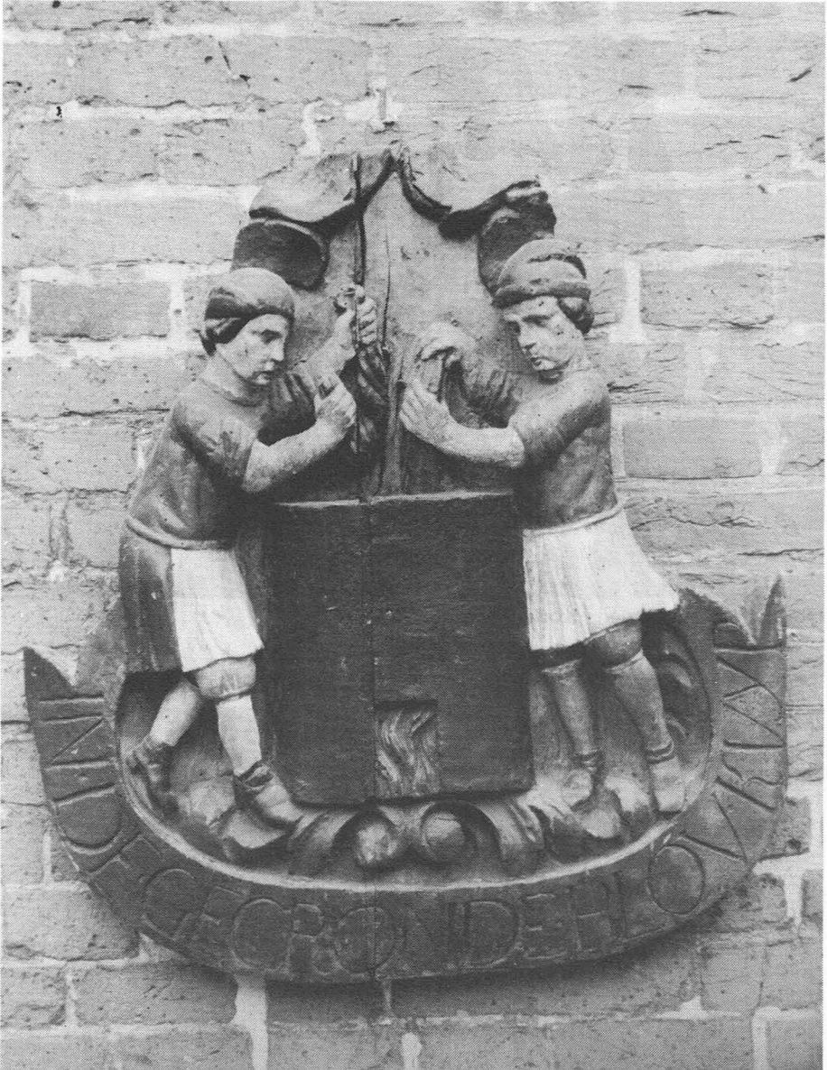
In de gecrone bloukuyp. - Mus. v. Volkskunde, Gent.