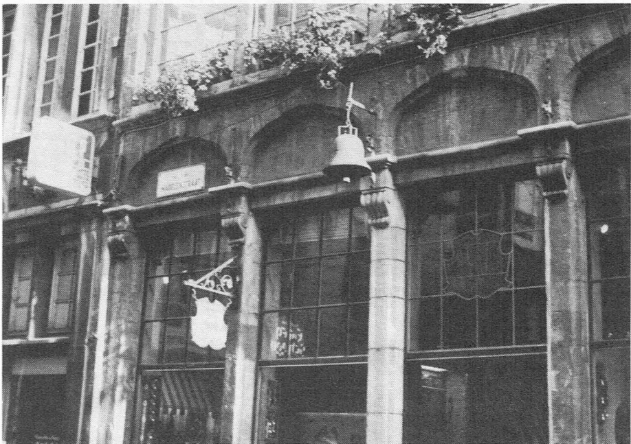
De Klok - Mageleinstraat.