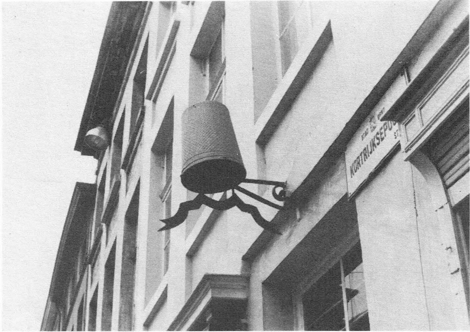
De gouden Vingerhoed - Kortrijksepoortstraat.