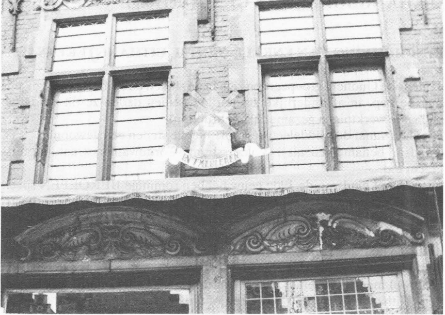
In 't Meuleken - Korenmarkt.

uit op verschillende plaatsen : kronen, dieren, sinterklaasafbeeldingen, scharen, molens, hoeden e.d.