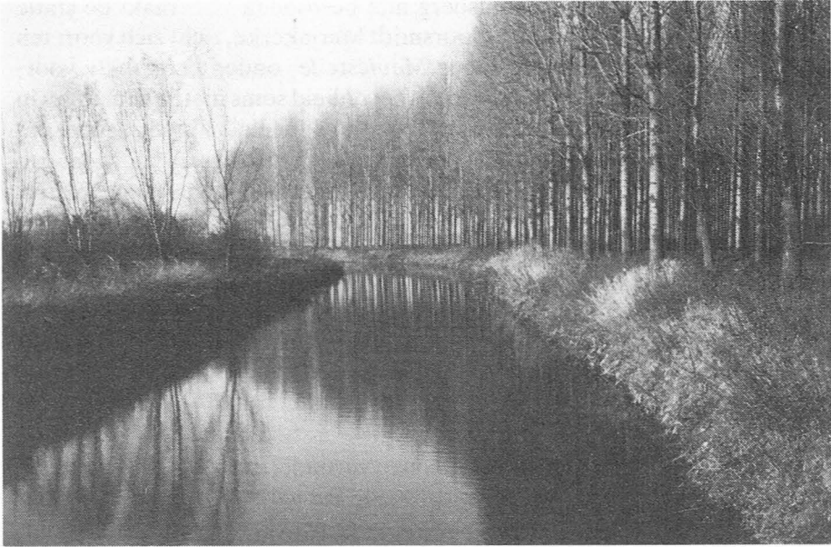
Afb. 6. Vaart van Stekene in de omgeving van de gewezen Baudeloabdij te Sinaai-Waas.