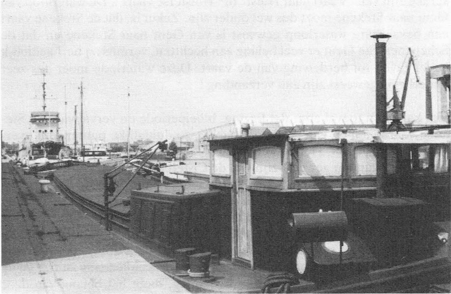
Afb. 4. Het Handelshok te Gent.