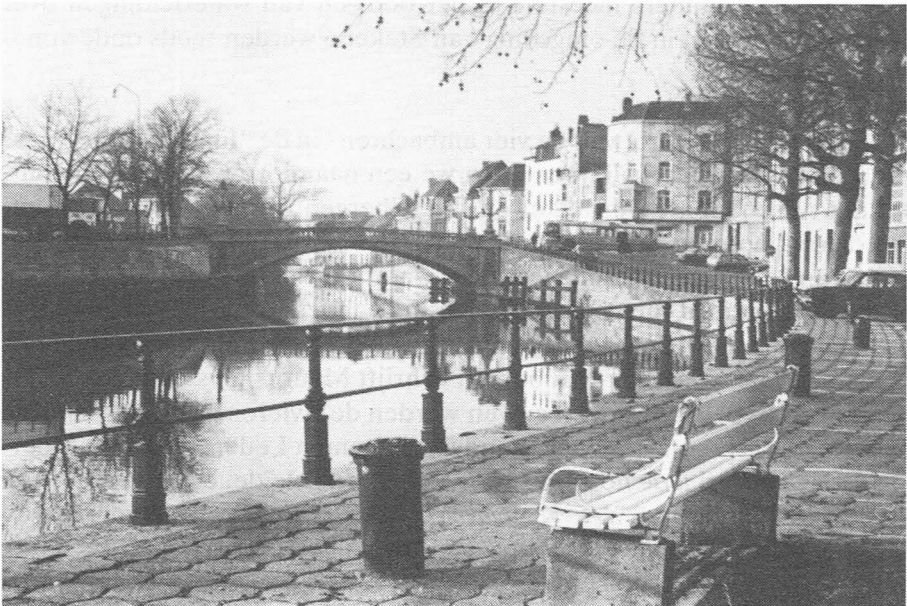
Afb. 3. Minne-meersbrug, Gent Rechts, voorbij de brug, loopt ondergronds het Stekene vaardeken.