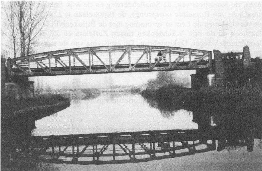
Afb. 7. Oude Spoorwegbrug over de Moervaart, in de omgeving van Splettersput.