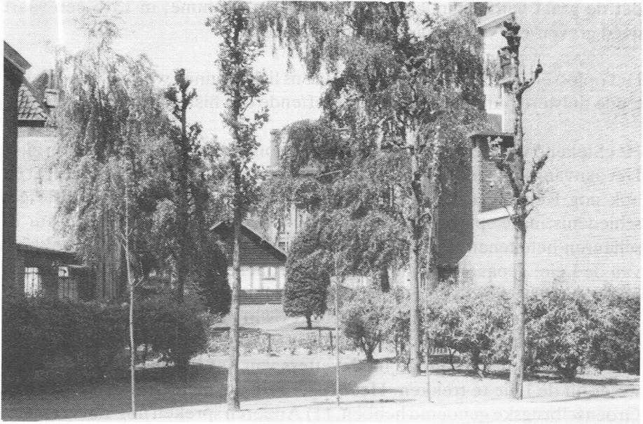
Afb. 2. Waar eens de Schipgracht was !