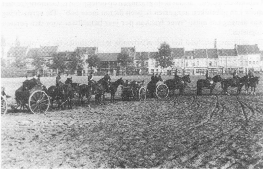
Afb. 4. 1e Artillerie Regiment op het Gentbruggeplein. Op de achtergrond de Brusselse steenweg.