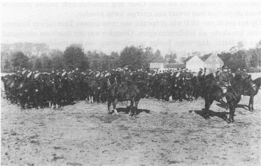
Afb. 5. 1e Artillerie Regiment op het plein te Gentbrugge.