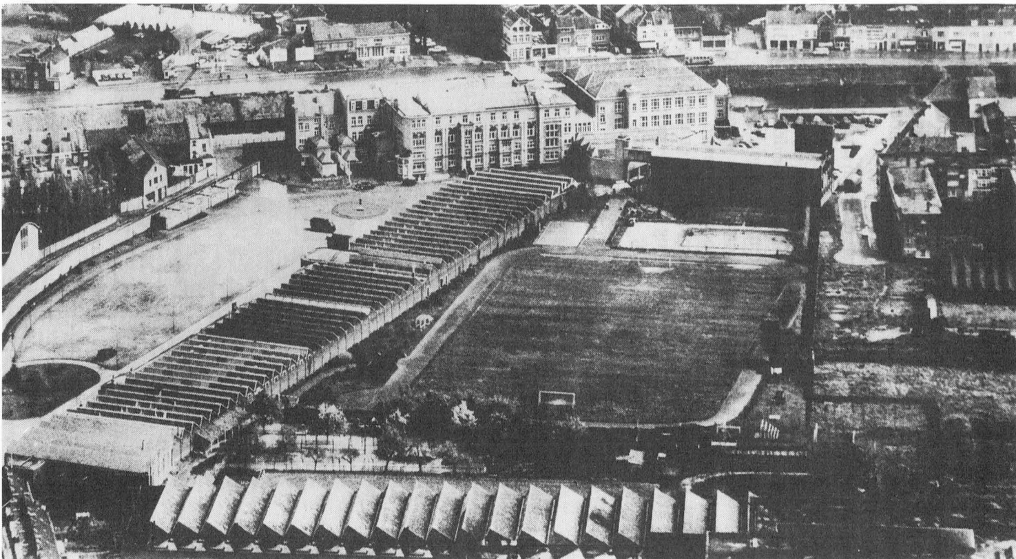
Afb. 4. Luchtfoto rond 1960. Er is nog geen enkel nieuw gebouw opgetrokken.