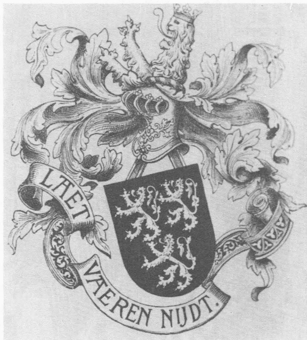
Afb. 5. Wapenschild van de Vaernewyck's.