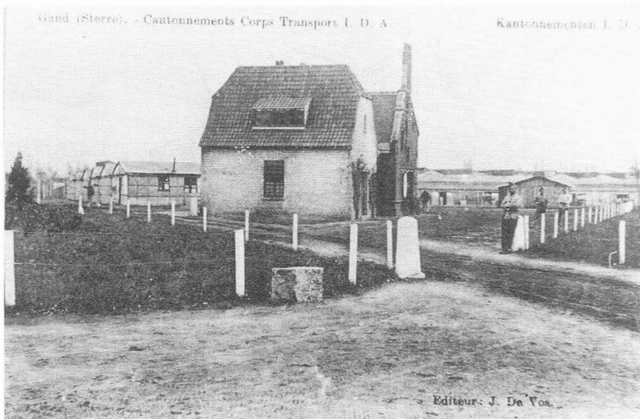
Afb. 3. Het Sterreplein juist na de eerste wereldoorlog. (Verzameling A. Verbeke).