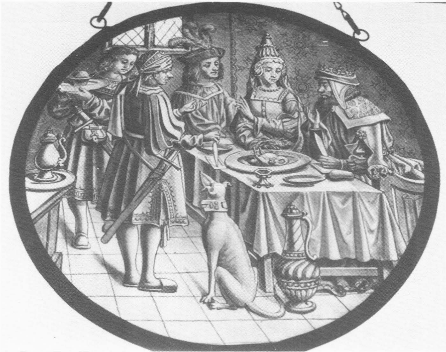
Afb. 26. Glasschildering door Theodoor Vermeulen.

geklasseerd, maar genoot in 1881 van een subsidie van 250 Fr en in 1883 van 150 Fr (69).