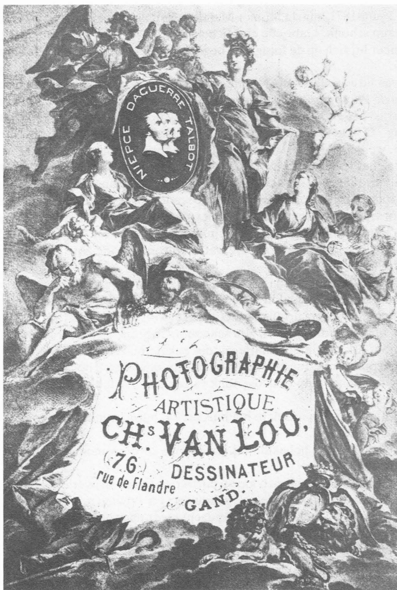
Afb. 21. Deel van een reclamefolder van Charles Van Loo.

St. Jansvest. Zijn atelier was een ontmoetingsplaats voor kunstenaars (60). Hij overleed vrij jong, 57 jaar oud, op 26 februari 1904. Zijn weduwe en zijn zoon zetten de zaak verder. Deze laatste, eveneens kunstfotograaf en schilder-tekenaar, leidde een vrij bewogen leven, verbleef van 1929 tot 1936 te Nice, en overleed in zijn geboortestad in 1963.