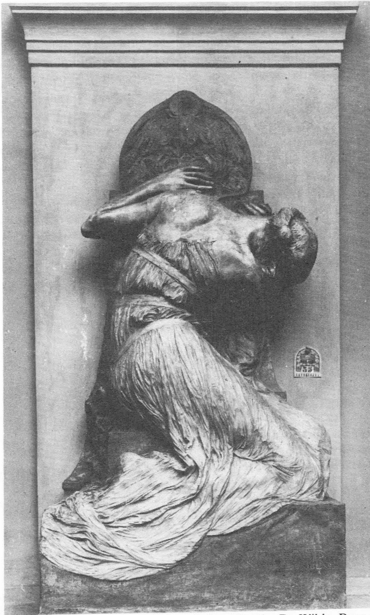
Afb. 32. "En Souvenir" in gips zoals door Charles De Wilde, Burgstraat 91 Gent, gefotografeerd in het eresalon van de Belgische afdeling van de Gentse Wereldtentoonstelling in 1913.

1944 werden de arm van de vrouwenfiguur en het dodenmasker van Jozef beschadigd en scheurde de arduinen plaat. Jules Van Biesbroeck Jr. dateerde het beeld in de studie van Arnaudiés als