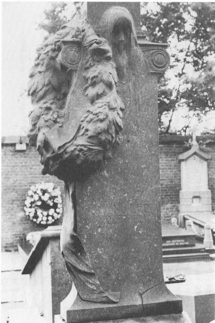
Afb. 19. Grafmonument voor Jan Foucaert op het erepark van de Westerbegraafplaats.