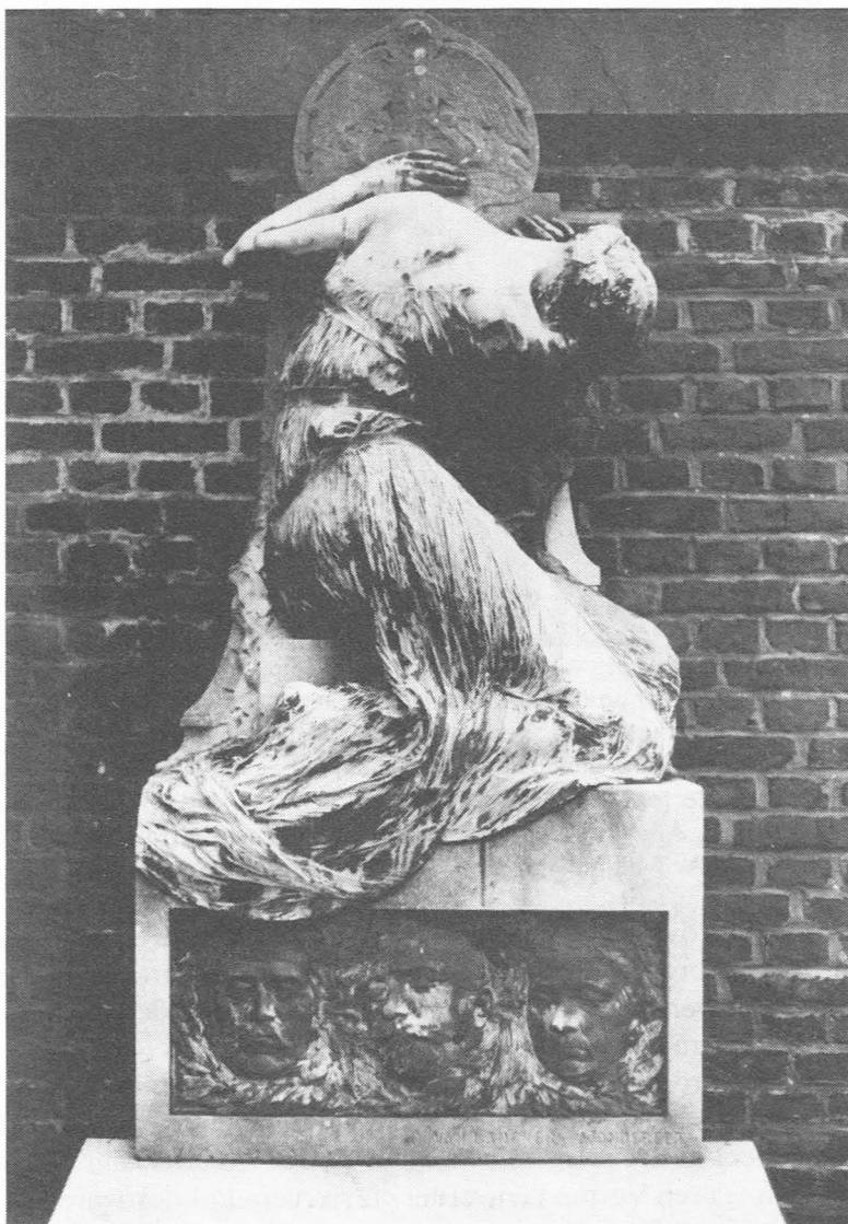
Afb. 31. Grafmonument door Jules Van Biesbroeck Jr. voor de familie Vermeulen op het erepark van de Westerbegraafplaats.

dodenmaskers draagt elk in een olijfkrans, van links naar rechts : Theodor, Jozef en Mathilde. Het blok dient als voetstuk voor een ongesigneerd bronzen beeld in romantisch-realistische stijl. Een geknielde treurende vrouw in een fijn geplooid gewaad, de rug naar de toeschouwer gekeerd en het hoofd naar beneden gericht, steunt met beide handen tegen een korte arduinen stele met afgeronde top, waarop een feniks in reliëf prijkt (74). Naast het beeld links, rankende klimop in het arduin gebeiteld. Bij de gevechten aan het einde van de Tweede Wereldoorlog in september