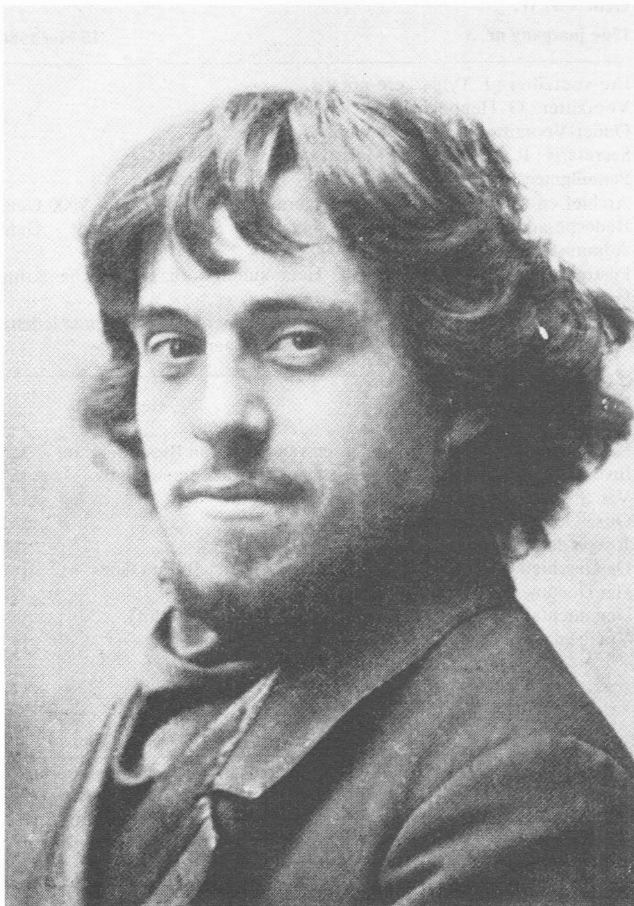
Afb. 1. Jules Van Biesbroeck Jr. zoals afgebeeld in het Italiaanse tijdschrift " Emporium " van april 1904.