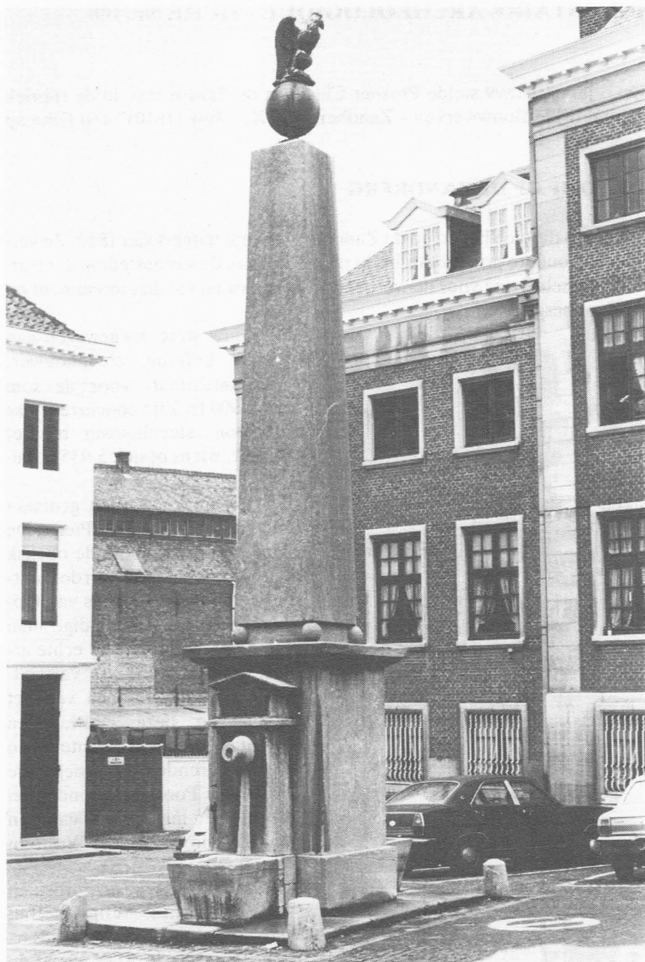
De Pomp op de Zandberg.