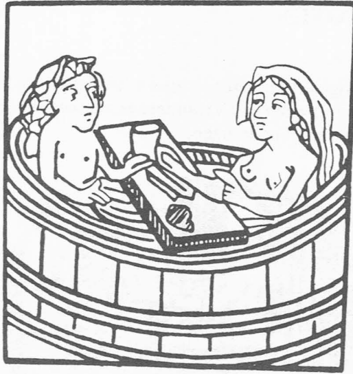
Fig. 2. “Van buiten water, van binnen wijn, Laat ons allen vrolijk zijn”, illustreert nog- maals dat baden, tafelen en stoeien toen heel normaal waren (Houtsnede uit een Augsburg- se kalender 1481)