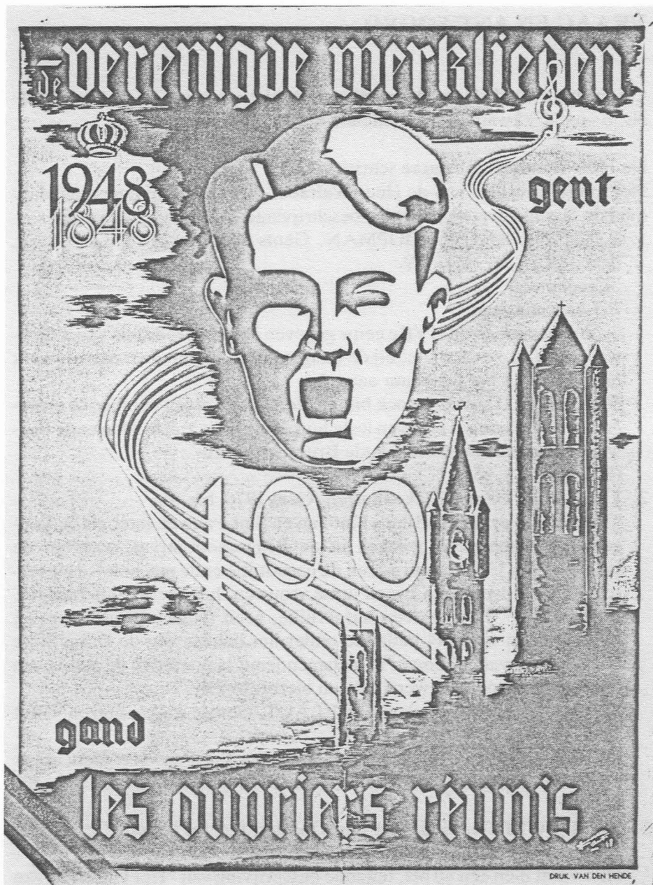
Affiche in 1948 ontworpen, ter gelegenheid van het 100-jarig bestaan van "Les Ouvriers Réunis" door student François Zenner.