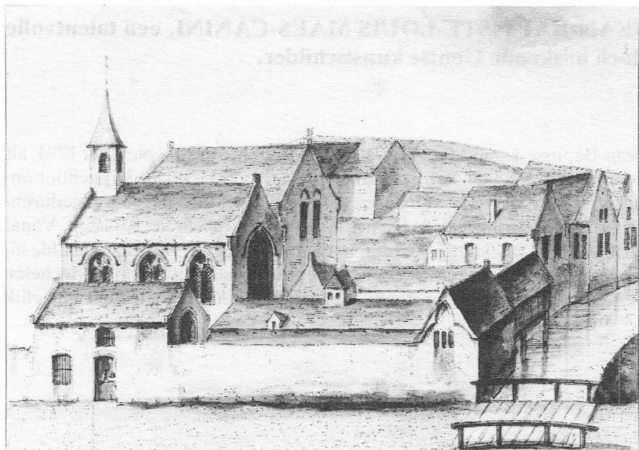
Afb. 3. Het Godshuis van Sint-Jan-in-de-Olie zoals het eruit zag in 1534.