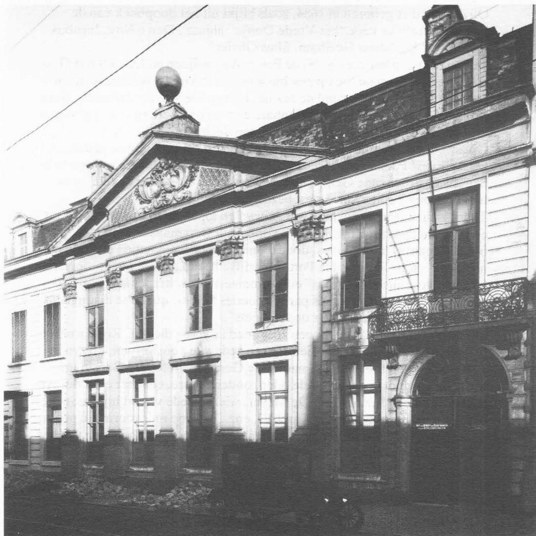
Hotel Reylof vóór de restauratie.