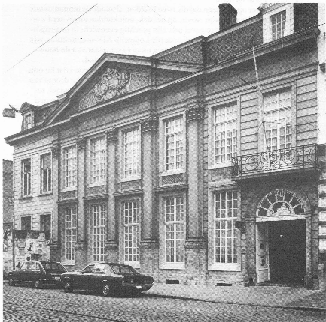
Hotel Reylof na de restauratie.