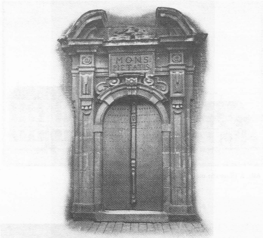
Afb. 1.

de deur- en vensteromlijstingen zijn in steen.