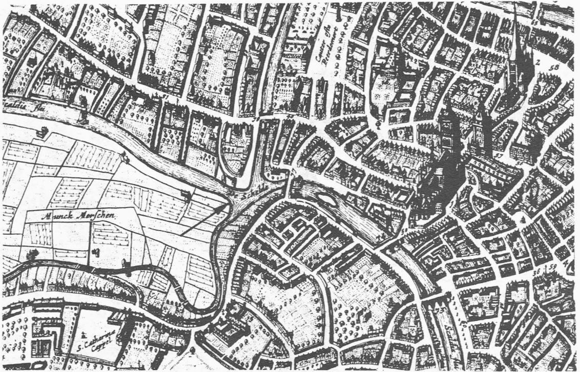
Fig. 3. Kaart Hondius 1641, ongeveer een eeuw later dan hierboven. Het oorspronkelijke steen is verbouwd.

Men zou al voor minder zijn haar recht zetten !