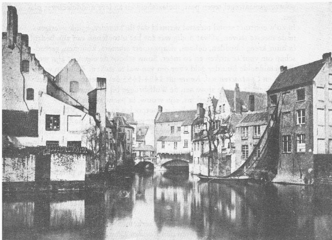
Fig. 4. Zicht op de oude watermolen van de Braemgaten en het Wandelaert-kasteel (links) met trapegevel en hoge schoorsteen. (foto stadsbestuur Gent 1883)

stoof of badhuis stond, die in 1460 het Valcxkin heette. Men heette die steeg ook de Corte Wijngaertstrate , “beneden de Nieubrugghen”, of ook nog in 1745, “Neffens de nieuwe Veemarct”. Dit straatje, dat in de Zilverstraat uitgaf, verdween met het maken van de Nieuwbrugkaai. De vertaling van 1812 in Rue du Poële was oneigen daar er hier sprake was van een étuve of bain .