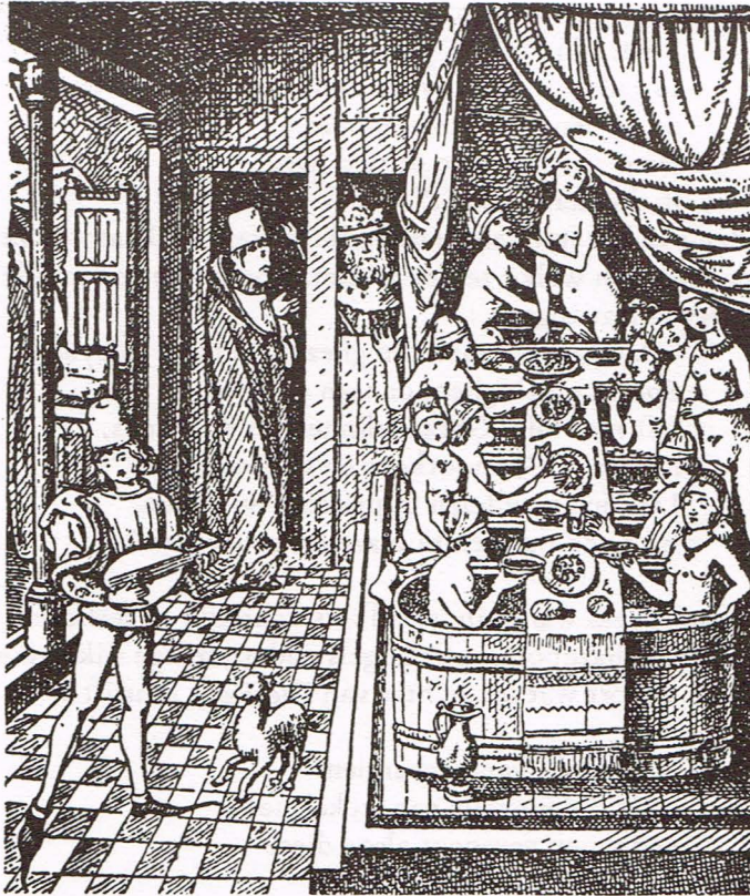
De vrije omgangsvormen, waarvan Poggio Bracciolini gewaagt, voor de hedendaagse mens wel wat al te vrijmoedig waren mede kenmerkend, voor de tijd van de Renaissance. Deze oude gravure stelt voor een maaltijd tijdens het (gemengde) baden.

“Komisch is het te zien, hoe verlepte oude vrouwen samen met frisse jonge meisjes het bad instappen en zich halfnaakt aan de blikken van de mannen blootstellen. Vaak krijgen de dames hun middagmaal in het bad opgediend op tafels, die op het water drijven. Aan de heren wordt het graag toegestaan aan deze verstrooiing deel te nemen. Een lust voor het oog zijn de jonge meisjes met hun stralende gezichten, schoon als jonge godinnen. Ze dansen en zingen in het water of zij spelen met een bal, die ze van de één naar de ander gooien.” (Fig. 1)