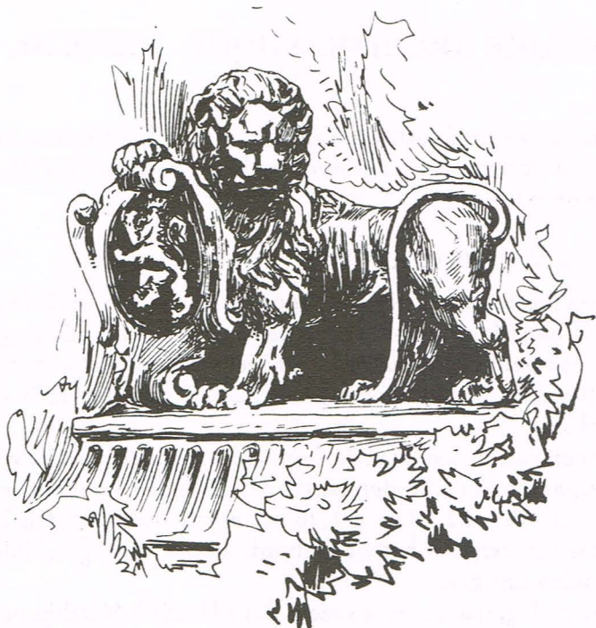
Afb. 1. Tekening die de fiche illustreerde.