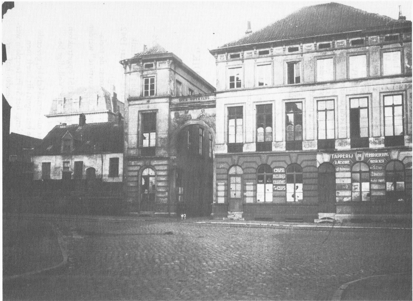
1. De Vreesebeluik : Voorgevel kant Blandijn.