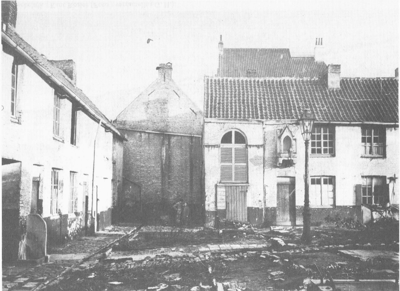
3. De Vreesebeluik : Binnenplaats Cité Ouvrière. Nu ingenomen door de Boekentoren.