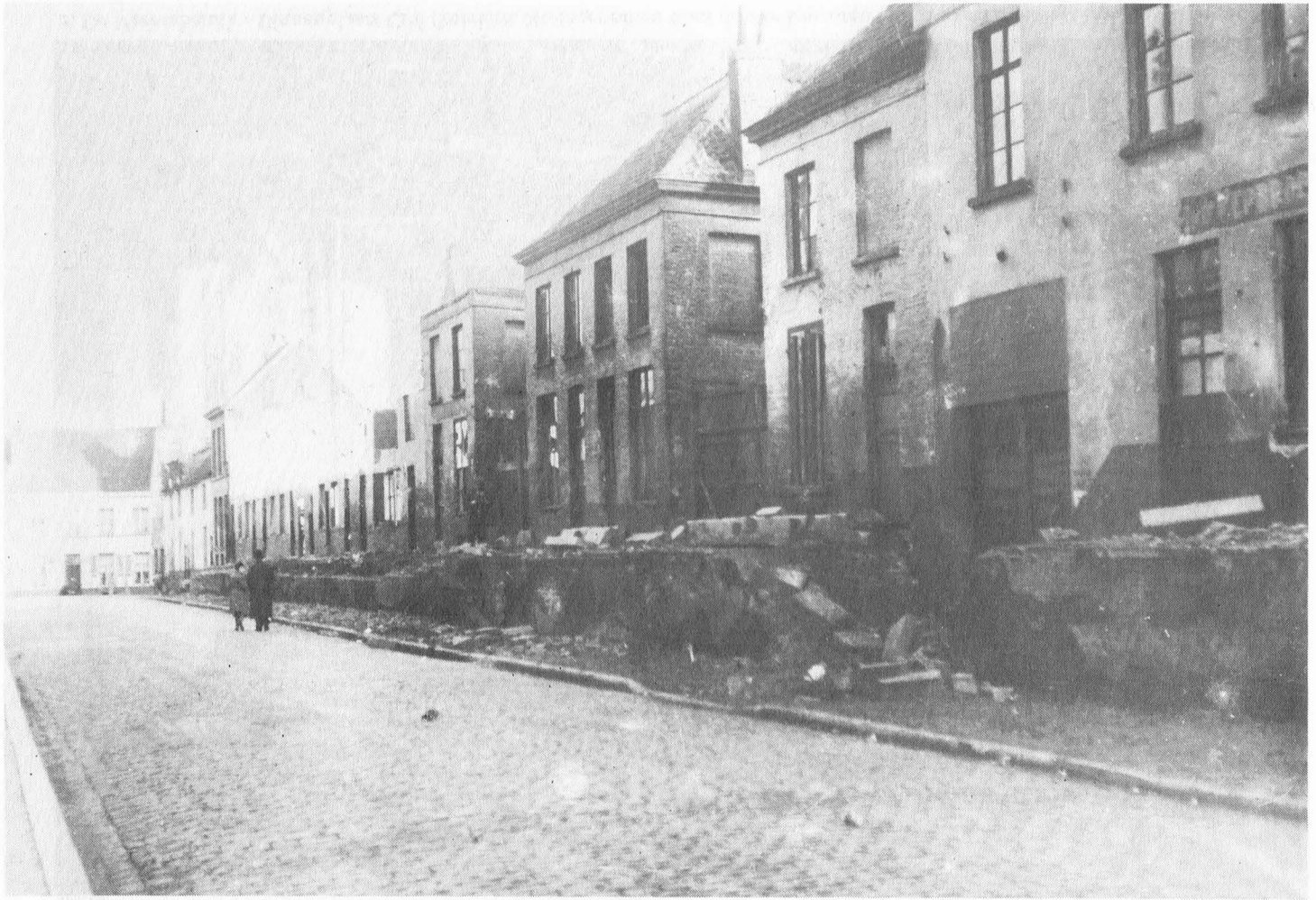
2. De Vreesebeluik : Kant Rozier (Foto : verzameling G. H.).