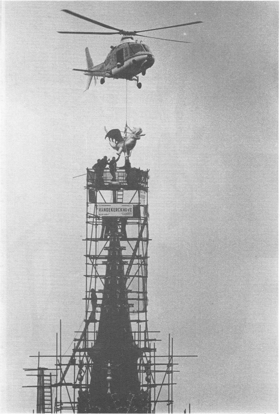
Het historisch moment.