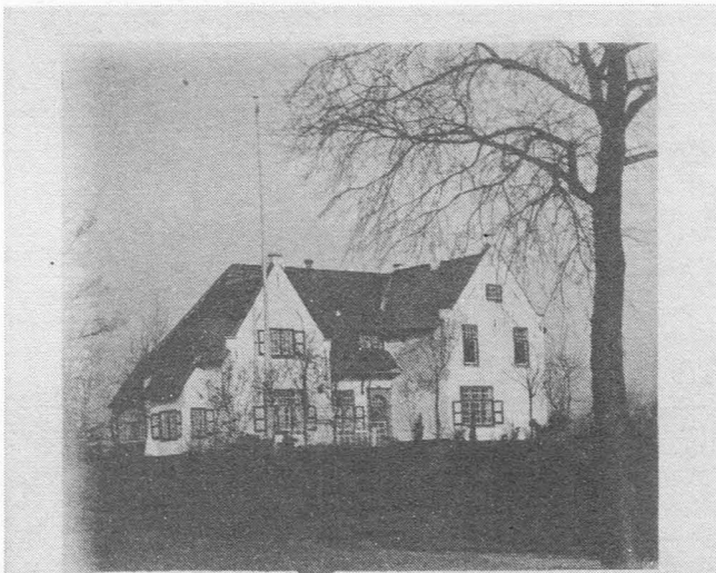
Het Lijsternest. Ingoijghem.