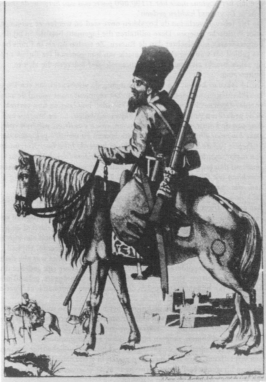
Donkozak in 1815.