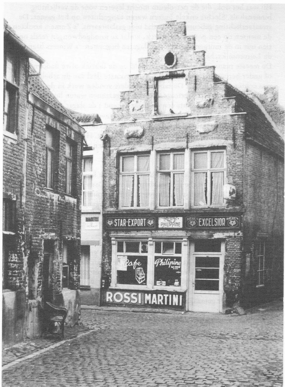
Café Philippe, hoek Corduwanierstraat en Rode Koningstraat.