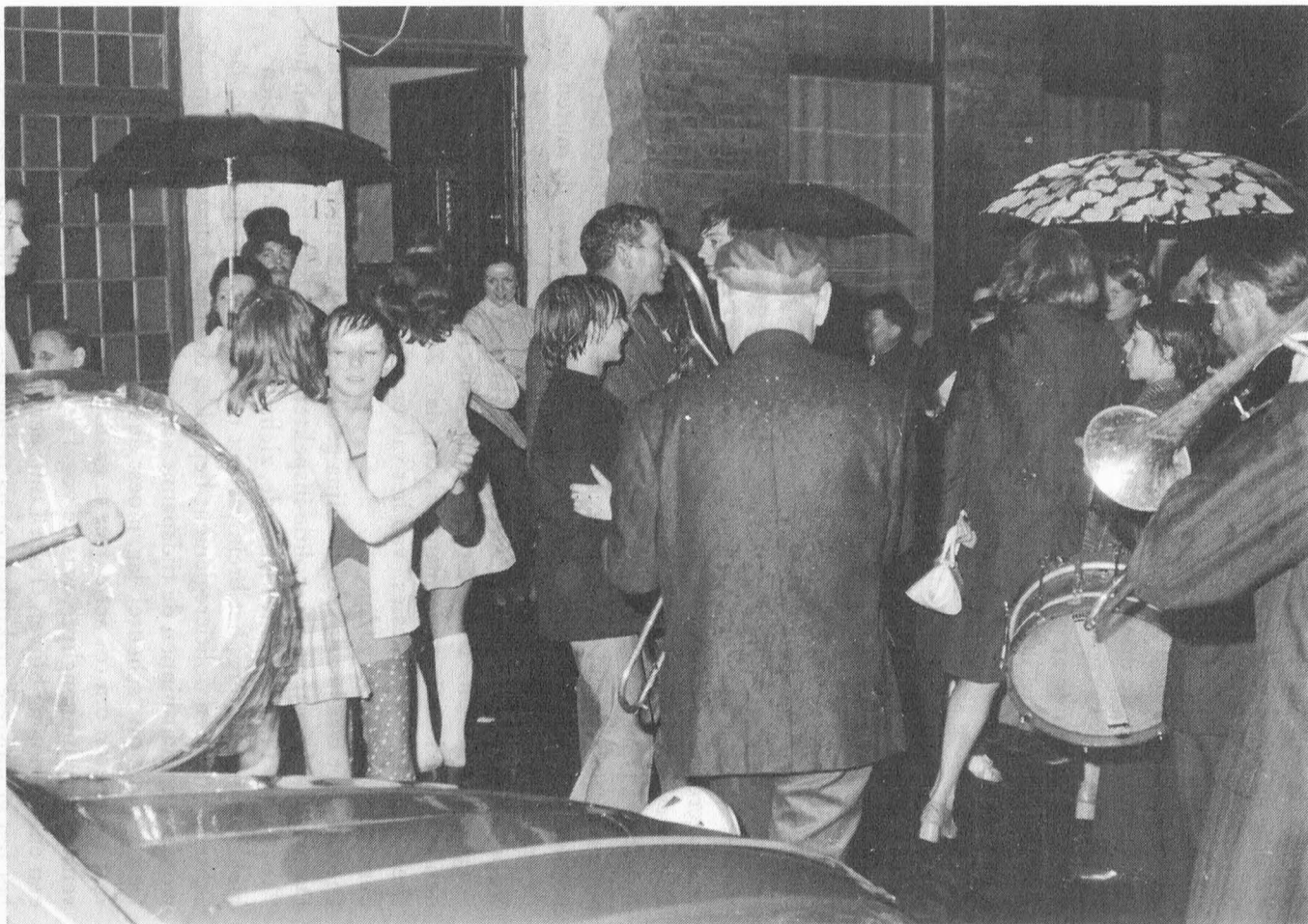
Geburtefeest Plotersgracht (14 augustus 1972)