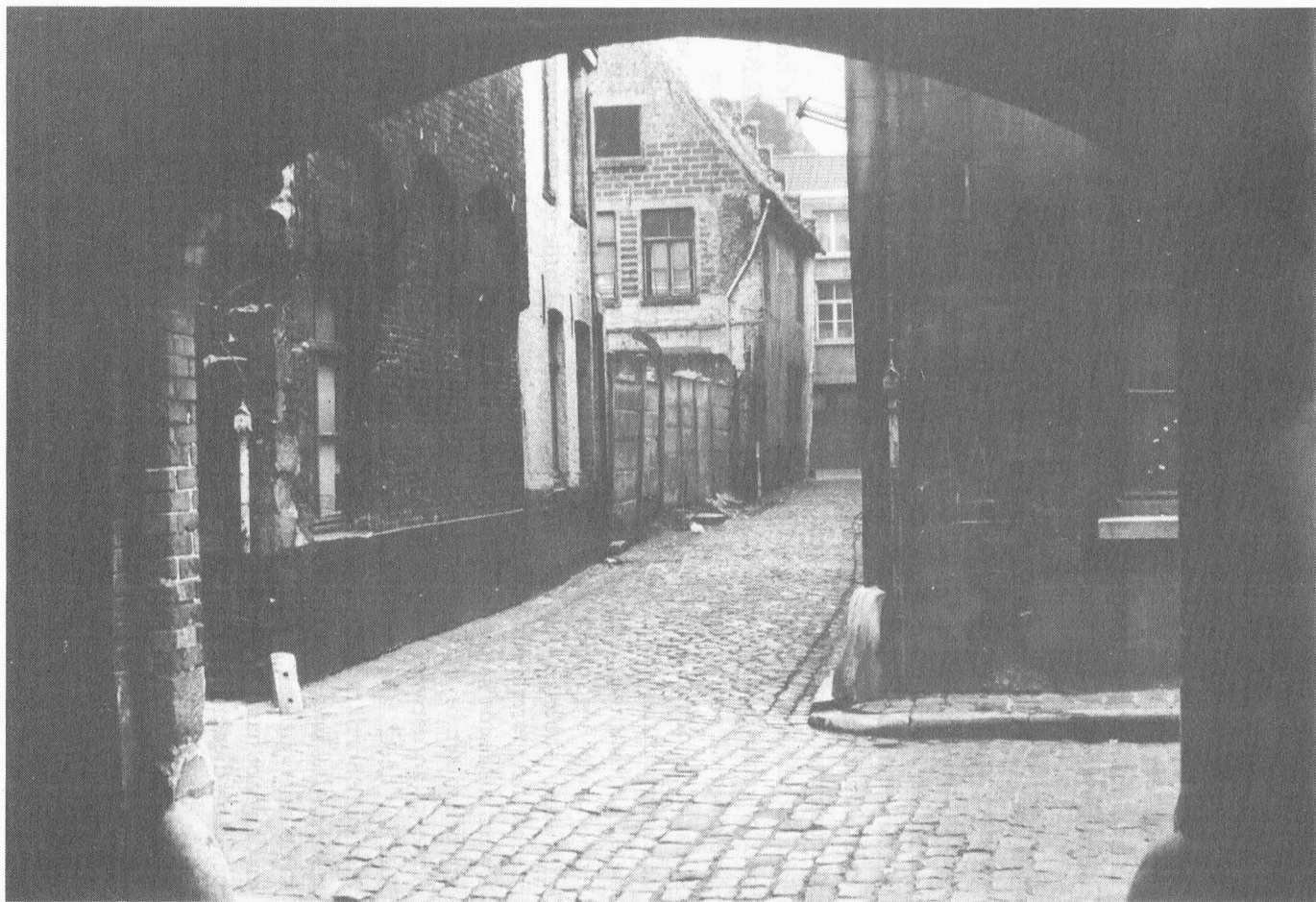
Onze-Lieve-Vrouwestraat, gezien vanaf Plottergracht. (december 1971)