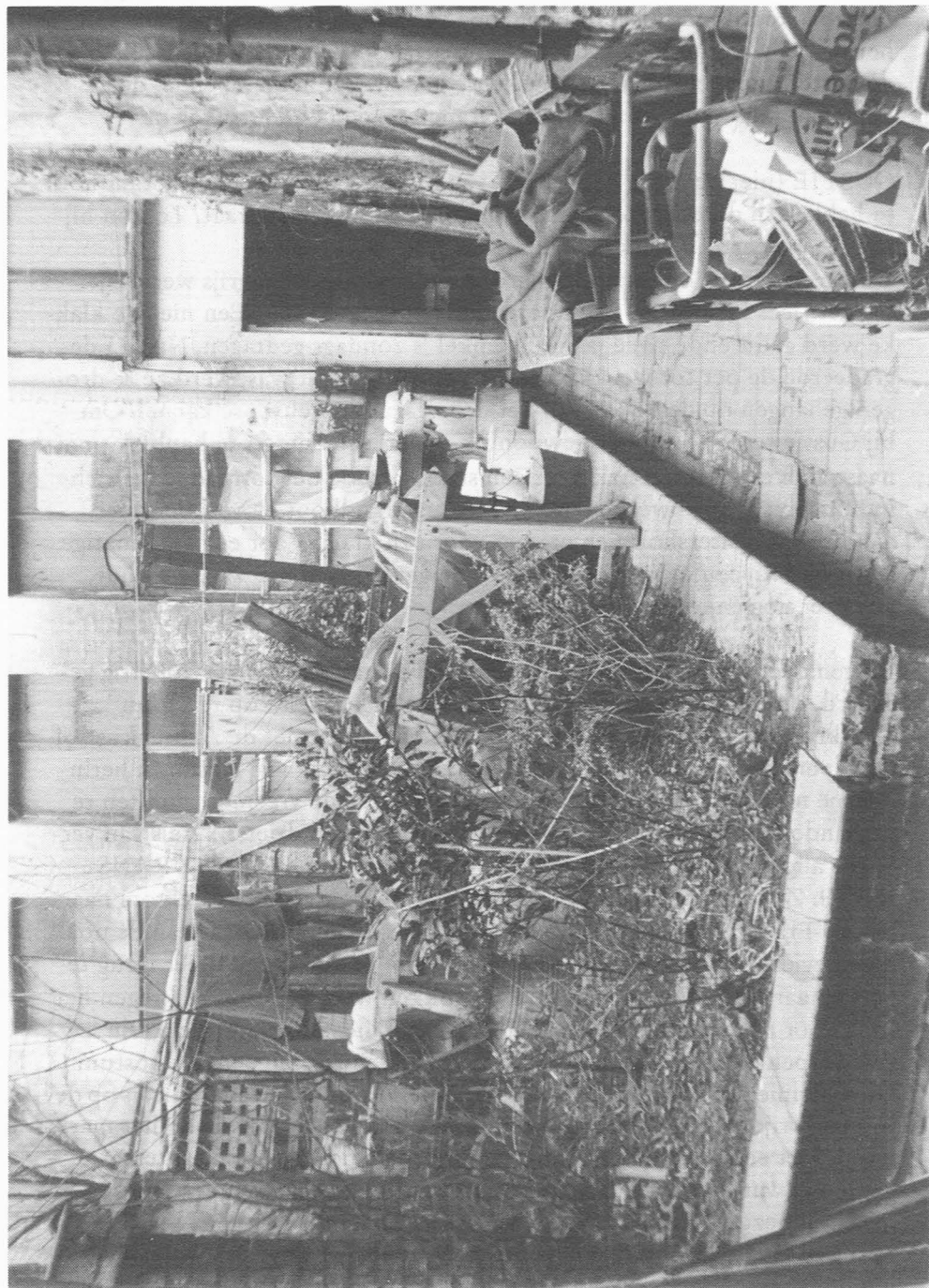
“Koertje” in de Corduwanierstraat (december 1971)