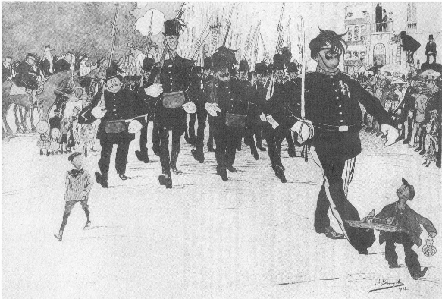
Revue op de Kouter – defilé van de Burgerwacht gezien door Jules De Bruycker – 1912. Museum voor Schone Kunsten Gent.