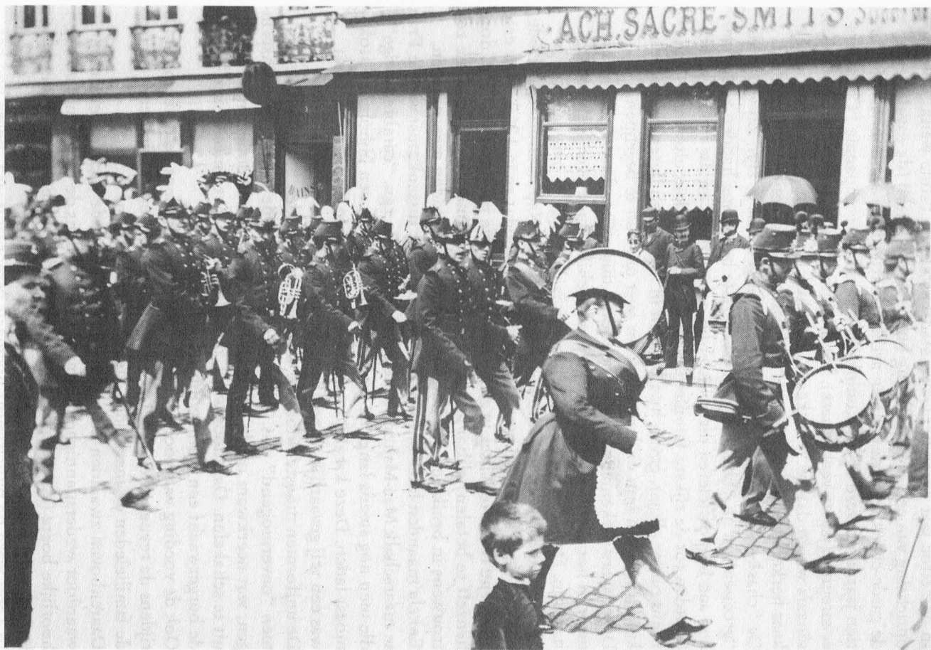
Defilé met muziekkapel aan het Koophandelsplein – ca. 1895.