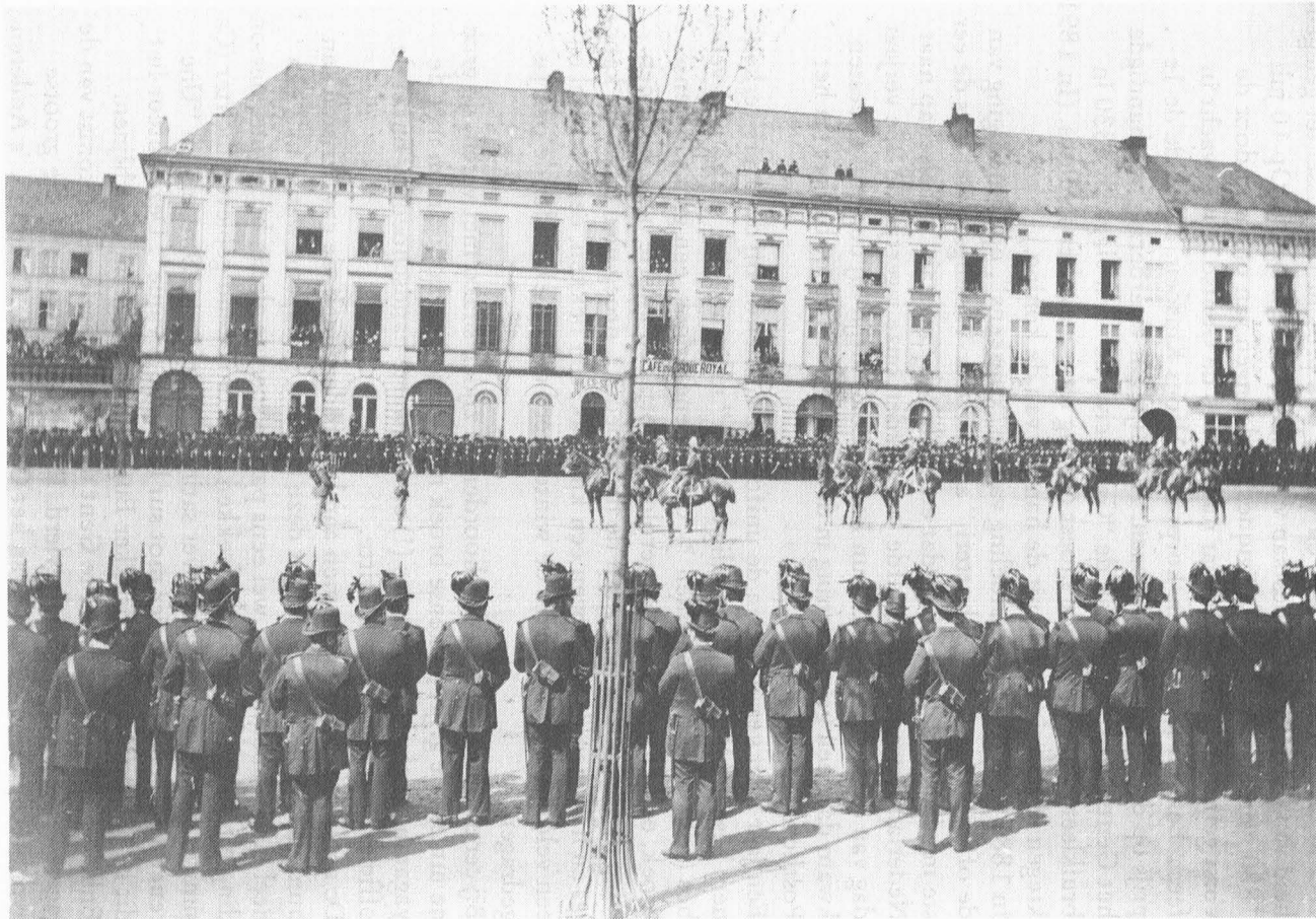
Grote revue op Sint-Pietersplein – ca 1895.