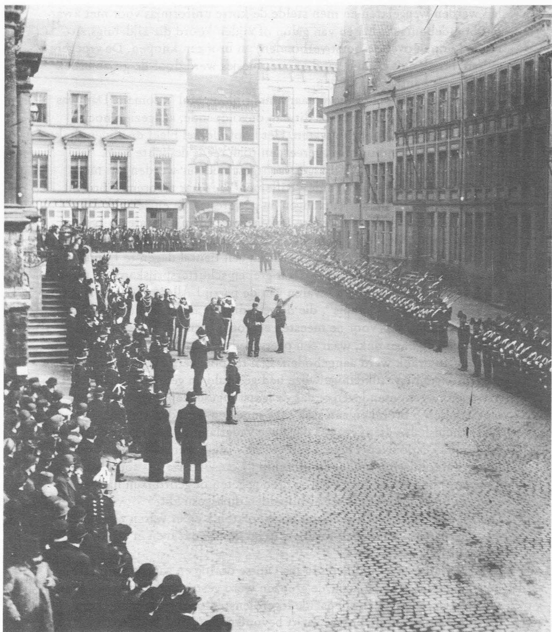
Revue op de Botermarkt – ca 1890.