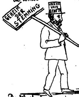
De klerikalen worden begraven