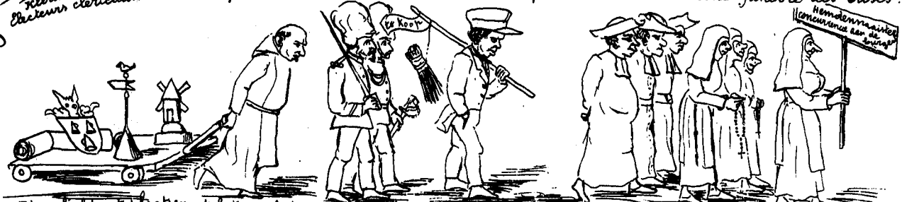
Zinnebeelden te plaatsen op het graf der gebuide kandidaten - Emblèmes à placer sur la tombe des candidats bues