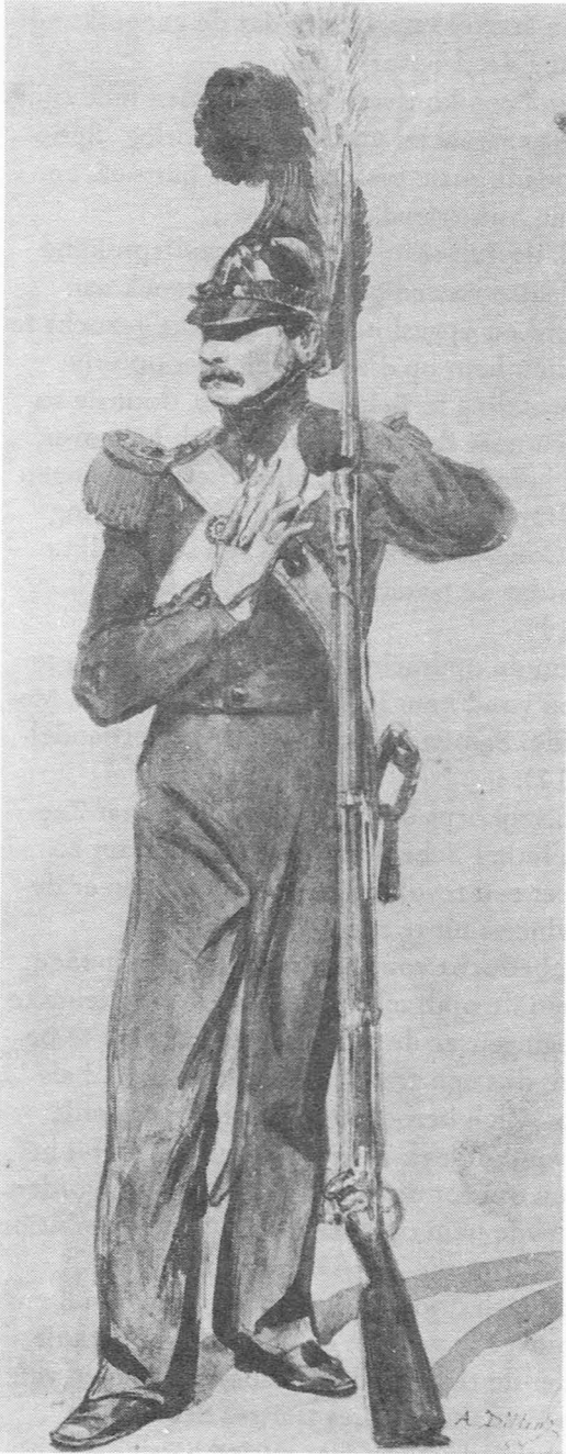
Gentse Pompiers : Infanterist.

gaan. Bij de schermutseling die hierop volgde brak Grégoire de pols van de officier en nam de vlucht met de degen van deze laatste. Nogmaals onder aanhoudingsmandaat geplaatst kon hij terug naar België uitwijken.