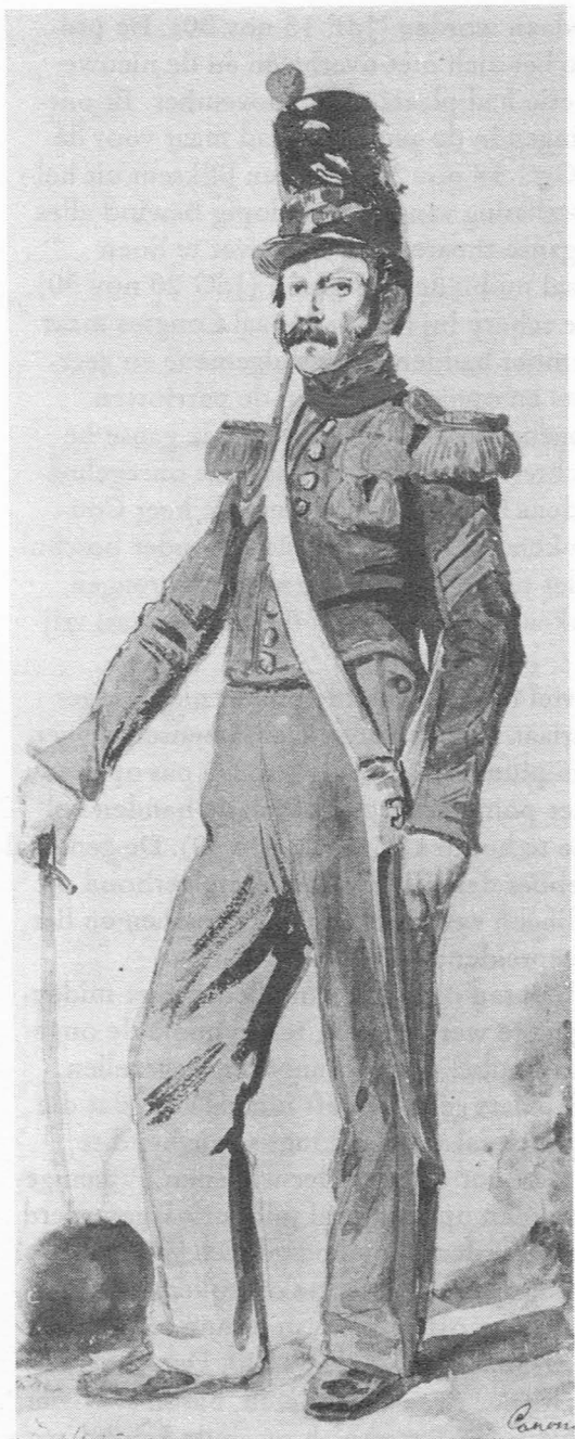
Gentse Pompiers : Kanonniers.

Bij de verkiezing voor het Nationaal Congres op 3 november namen de patriotten weerwraak. Buiten P. De Ryckere, die wel de meeste stemmen wegdroeg, kwamen de elf andere verkozenen uit het kamp der patriotten (JdF 6 nov 30). Volgens de "Journal de Gand" zijn de verkiezingen niet fair verlopen (4), door het veranderde systeem van "cyns en capacitaire" kiezers is het grote voordeel naar de patriotten gegaan (5). Het was inderdaad dank zij de stemmen van de geestelijkheid en van de plattelandsbewoners, die overwegend katholiek waren, in tegenstelling met de welstellende Gentse burgerij die bijna volledig liberaalgezind was, dat de patriotten het pleit gewonnen hadden. (JdG 10 nog 30).