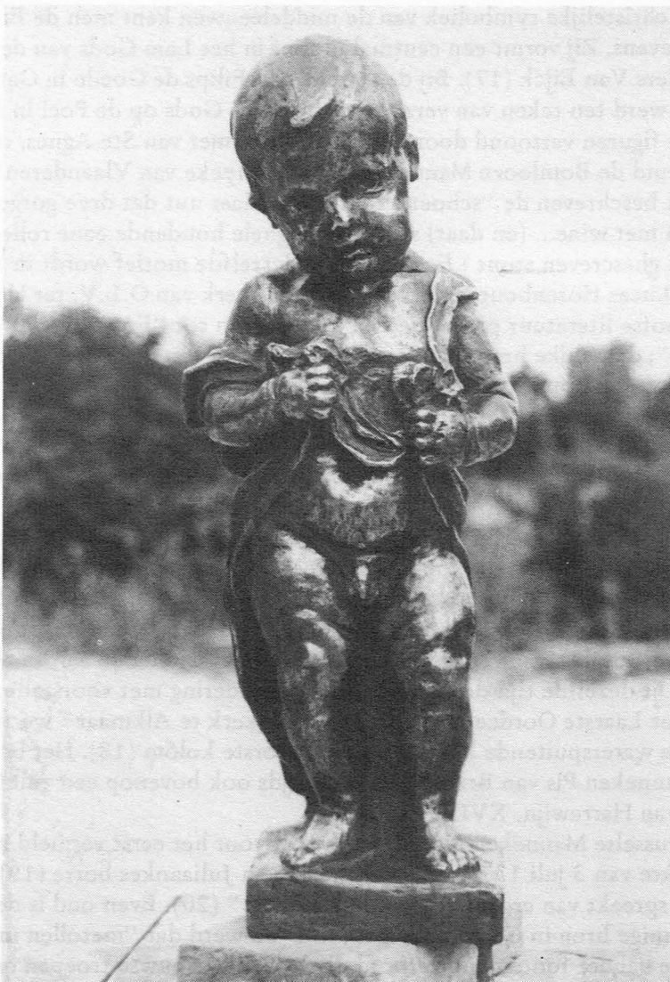
Fig. 4. Het nieuwe Manneken-Pis van Gent

periode met voorstelling van een wijnoogsttafereel (15). Zoals bij het eerstgenoemde beeld en zoals ook te Gent, heft het kind hoog zijn hemdje op om zijn behoefte te doen. Een ander Manneken-Pis uit de Oudheid treft men in het British Museum (16). Dergelijke putti, bedrijvig in de wijnoogst of deel uitmakend van een dionysische optocht, versierden in de Romeinse tijd de sarcofagen van kinderen, omdat de wijn onsterfelijkheid verleent.