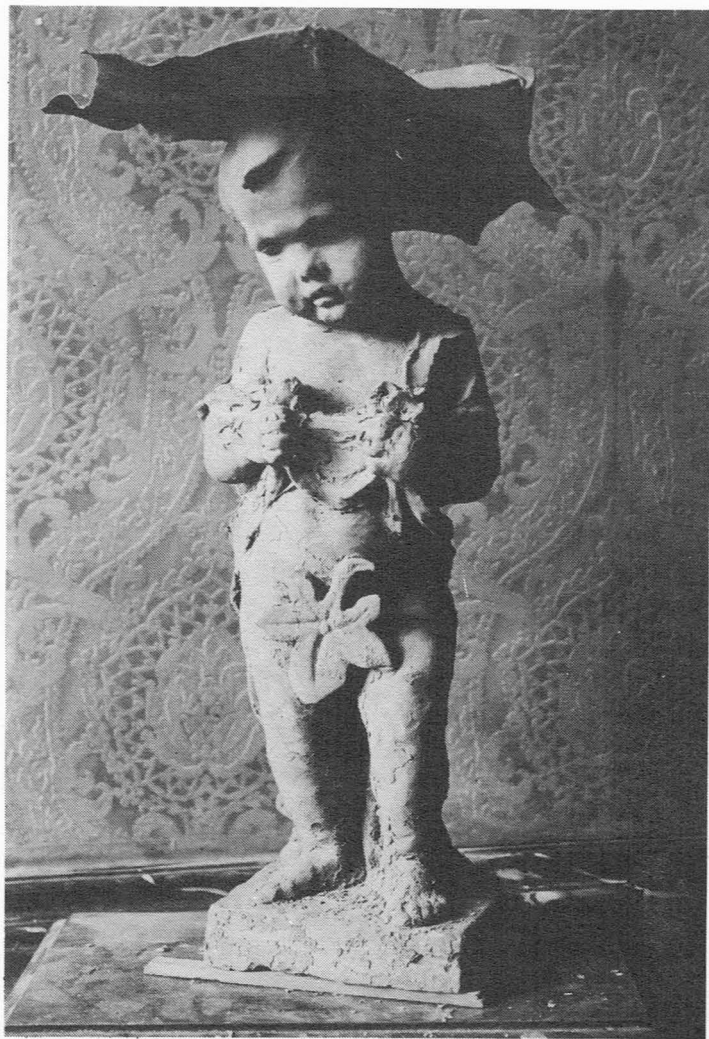
Fig. 1. MANNEKEN-PIS MET REGENSCHERM EN VIJGBLAD, vóór 1950.