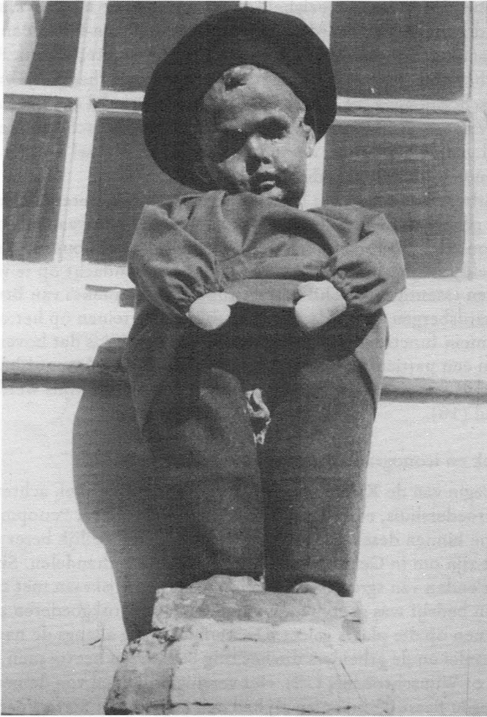
Fig. 3. Manneken-Pis met kostuum op 6 oktober 1963.

these “que ce serait l'échevin Siffer, dont on n'attendait pas pareille mesquinerie, inspiré, paraît-il, par l'ineffable Mademoiselle Boonants, qui aurait donné ordre de masquer la virilité naissante du petit bonhomme...”