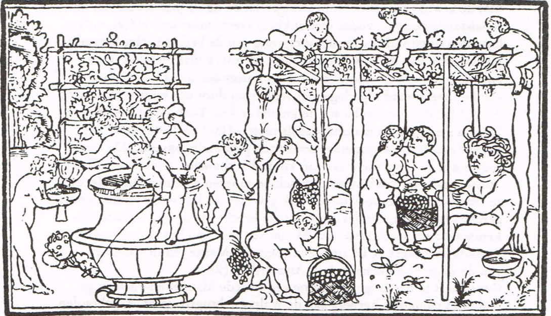
Fig. 5. De wijnoogst uit de Hypnerotomachia Poliphili (Venetië, 1499).