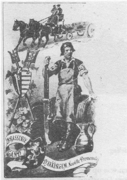
Prentkaart van de brouwerij Akkergem.