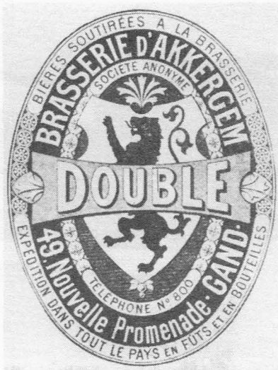
Etiket van de Brouwerij Akkergem.