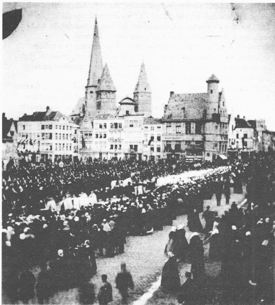
Feestelijke optocht op 2 mei 1865

van Marten Volcaert, schepen te Gent in 1539.