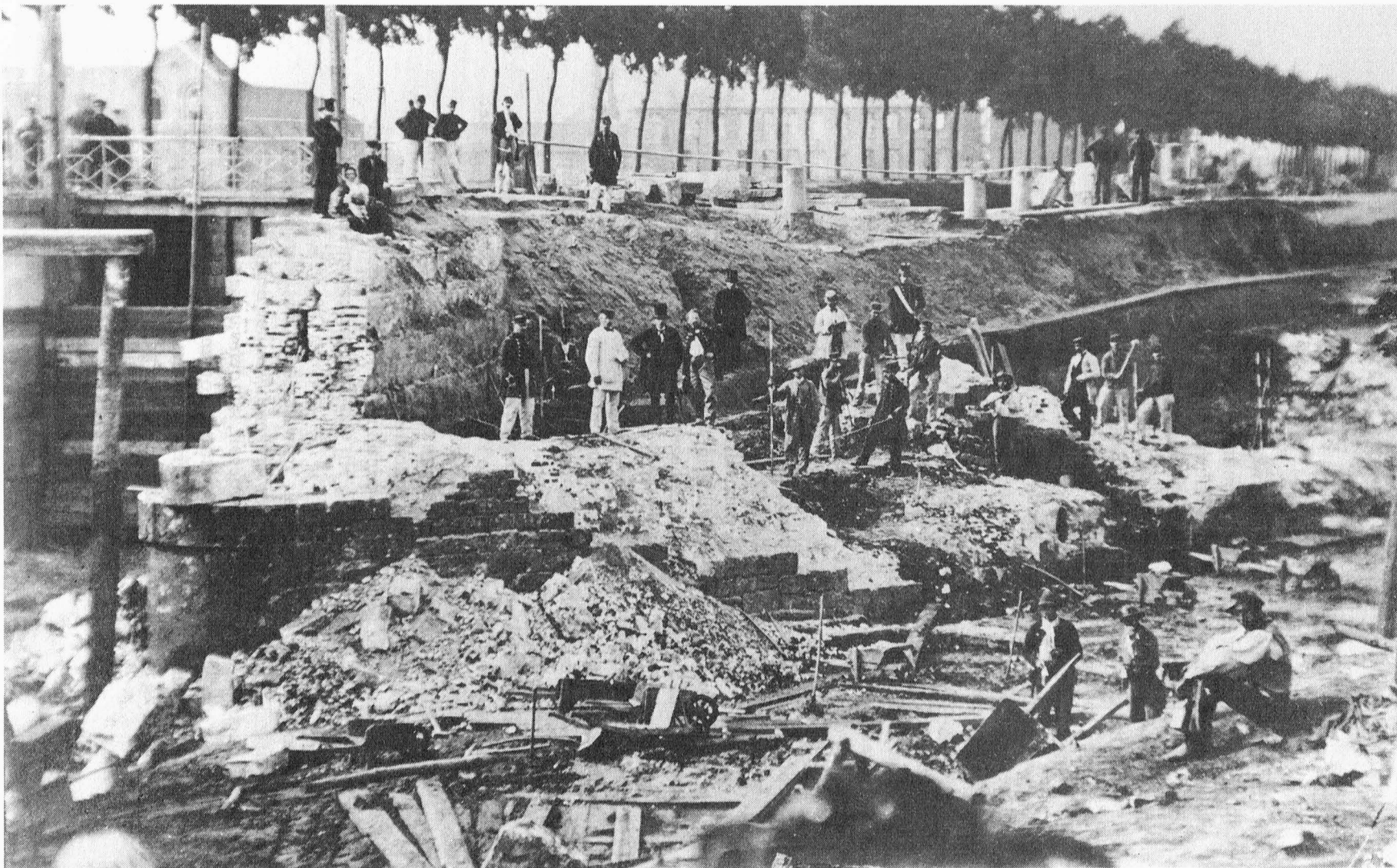
Het opblazen van de Tolhuisbrug te Gent op 20 mei 1864.