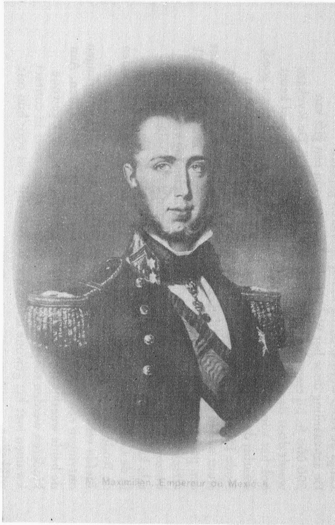
Portret - Keizer Maximiliaan