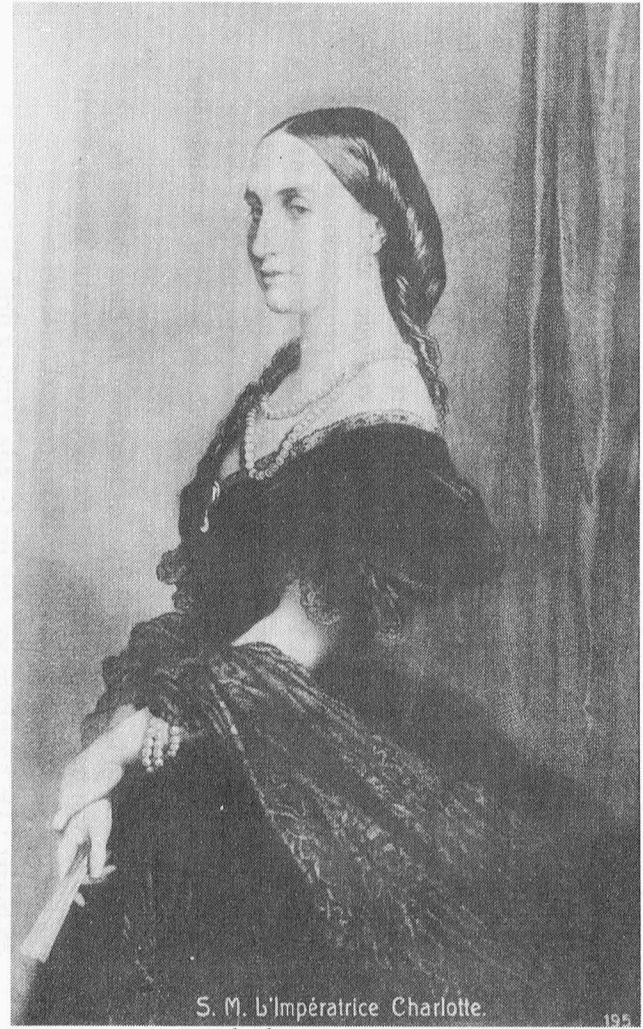
S. M. L'Impératrice Charlotte. Portret - Keizerin Charlotte