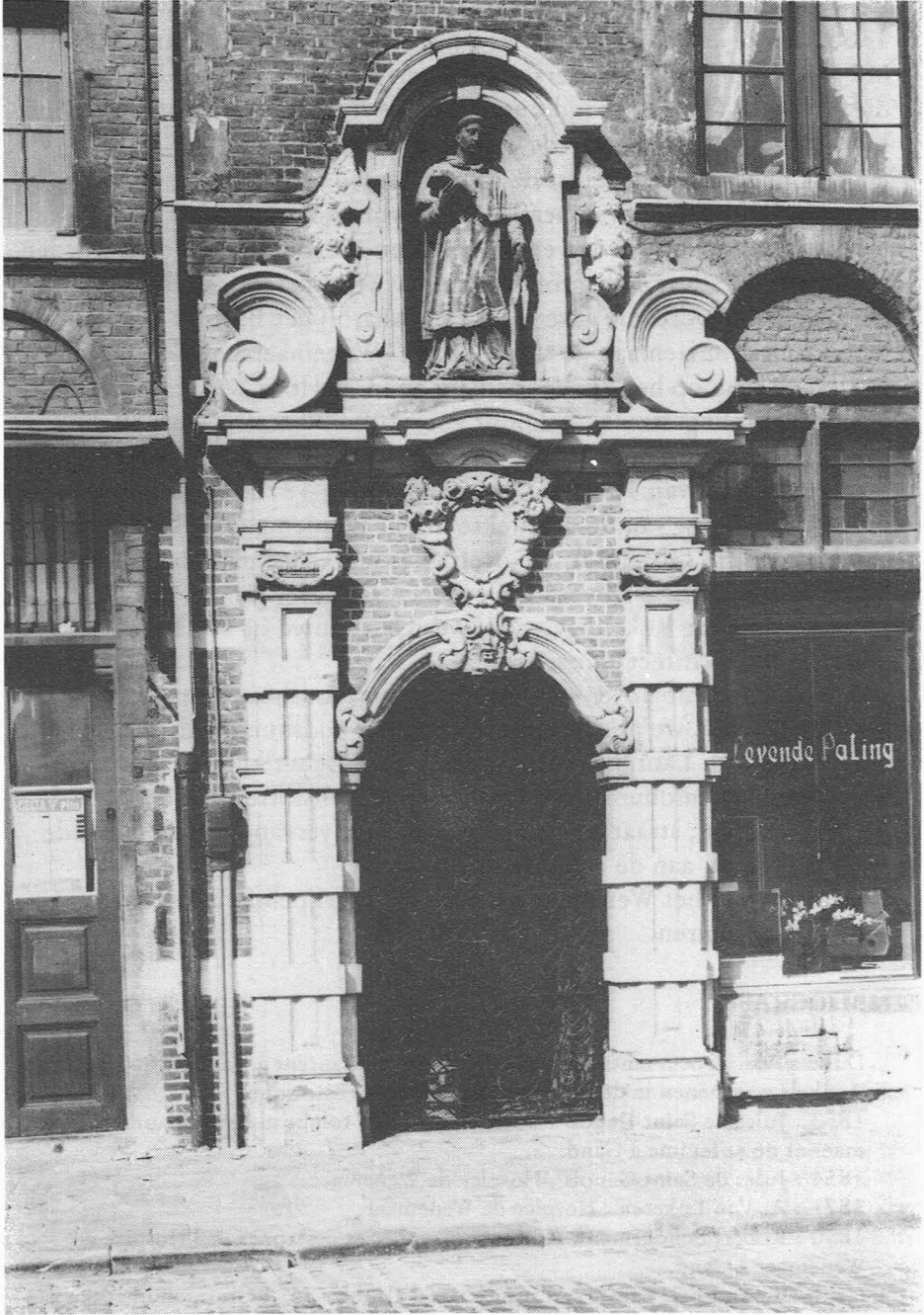
Poort van het Wenemaer-godshuis.