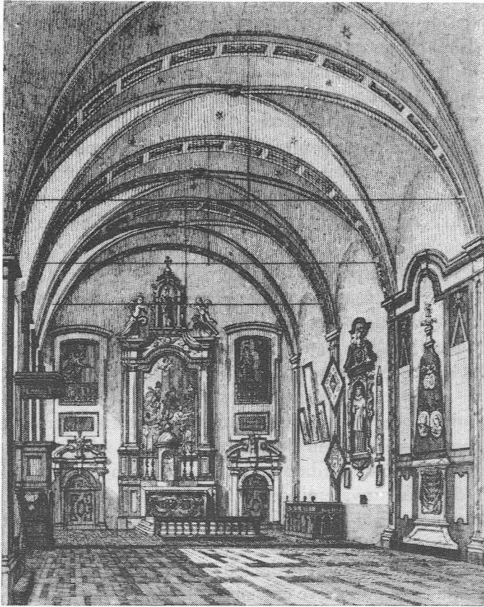
Binnenzicht van de Wenemaerkerk

bij de interest van het kapitaal, indien het godshuis zou worden verkocht en we komen voor 1863 voor een uitgave van 407,39 fr. per provenierster. Het verschil in uitgave per inwoner en per dag van het Sint-Antoniushuis en het Wenemaersgodshuis bedraagt 0,57 fr. of voor 30 proveniersters 6 156 fr. per jaar. In het St.-Antoniushuis is er voldoende plaats om de proveniersters van het Wenemaershuis op te nemen.