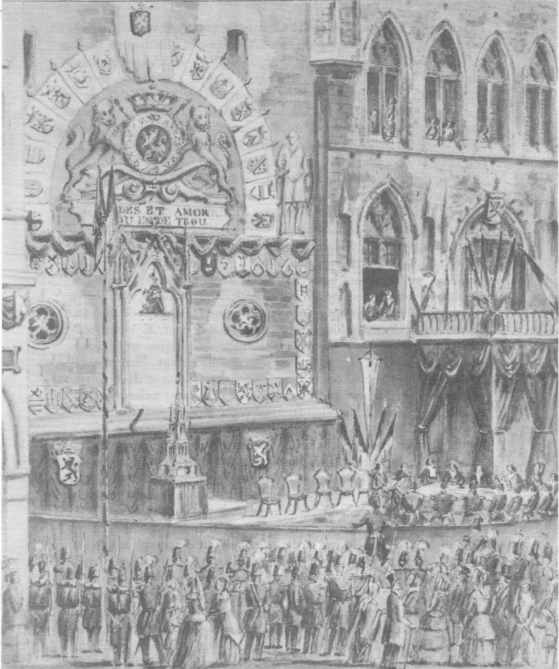
1 September 1853. Plaatsing van een gedenksteen op het Belfort door koning Leopold I