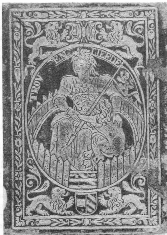
Plat (93 mm x 62 mm) van een exemplaar van de Almanach ofte Waer-Zegginghe voor het Jaer ons Heeren Iesu Christi, M. DC. LXV. Te Ghendt Ghedruckt by Bauduijn Manilus woonende inde Witte Duyve, 1665.

sous la protection du Lion de Flandre, apparaissait ici seule, sur un trône élevé(...) la tête ceinte de la couronne murale en or, sa couronne symbolique(...)portant un manteau de velours noir au lion d'argent, tient la hampe de sa bannière séculaire." (11)