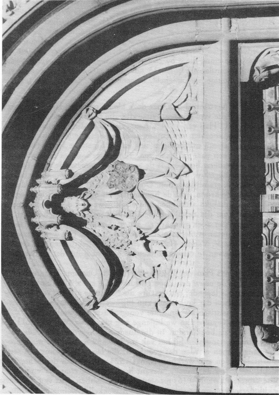
Postgebouw : De Maagd van Gent.