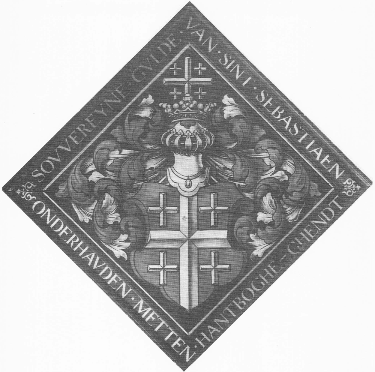
Blazen van het Sint-Sebastiaansgild. Paneel 105,5 x 105,5 cm. Oudheidkundig museum Bijloke.