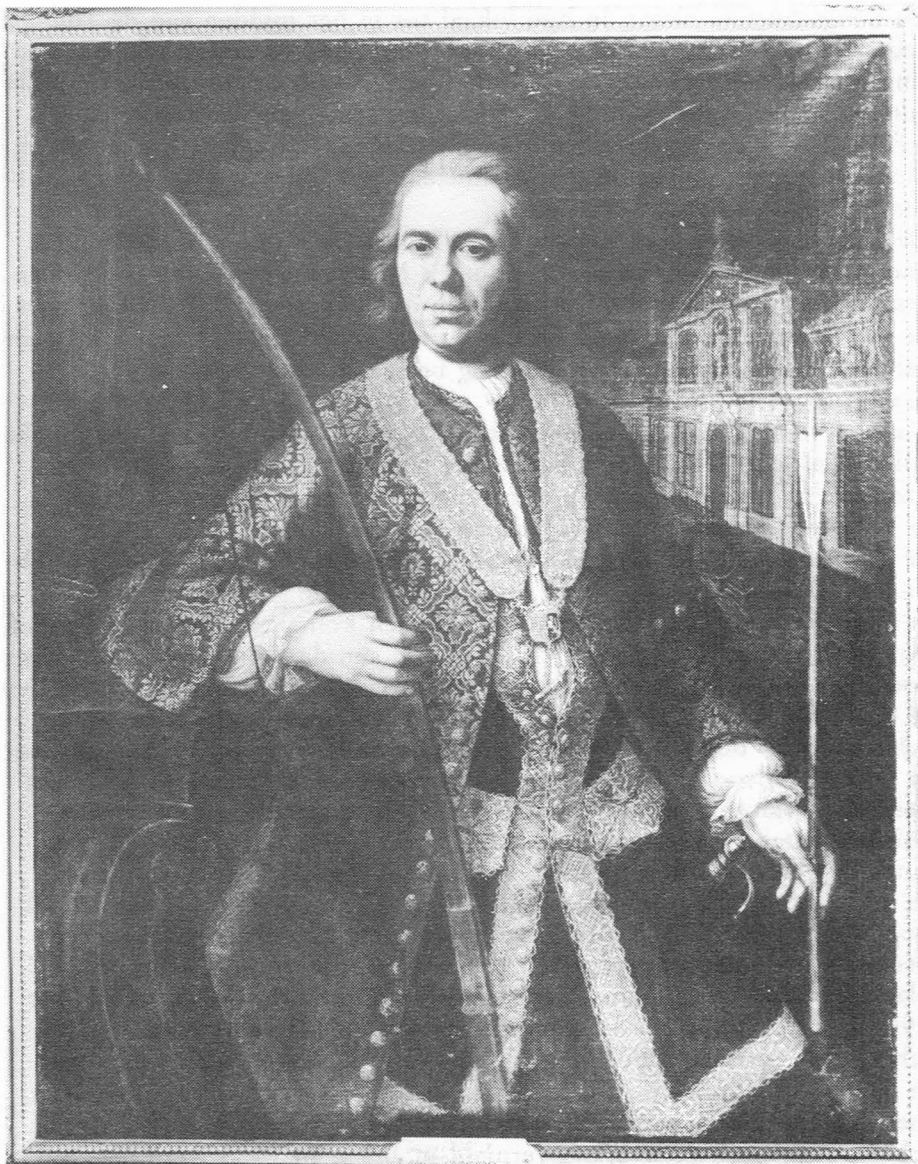
Portret van een Koning van het Sint-Sebastiaansgild, door anoniem meester uit de 18e eeuw. Achter hem ziet men links de Schietgaaï en rechts het Huis van het Sint-Sebastiaansgild op de Kouter. (Oudheidkundig museum Bijloke) (zie Catalogus van de Schilderijen nr. 197).