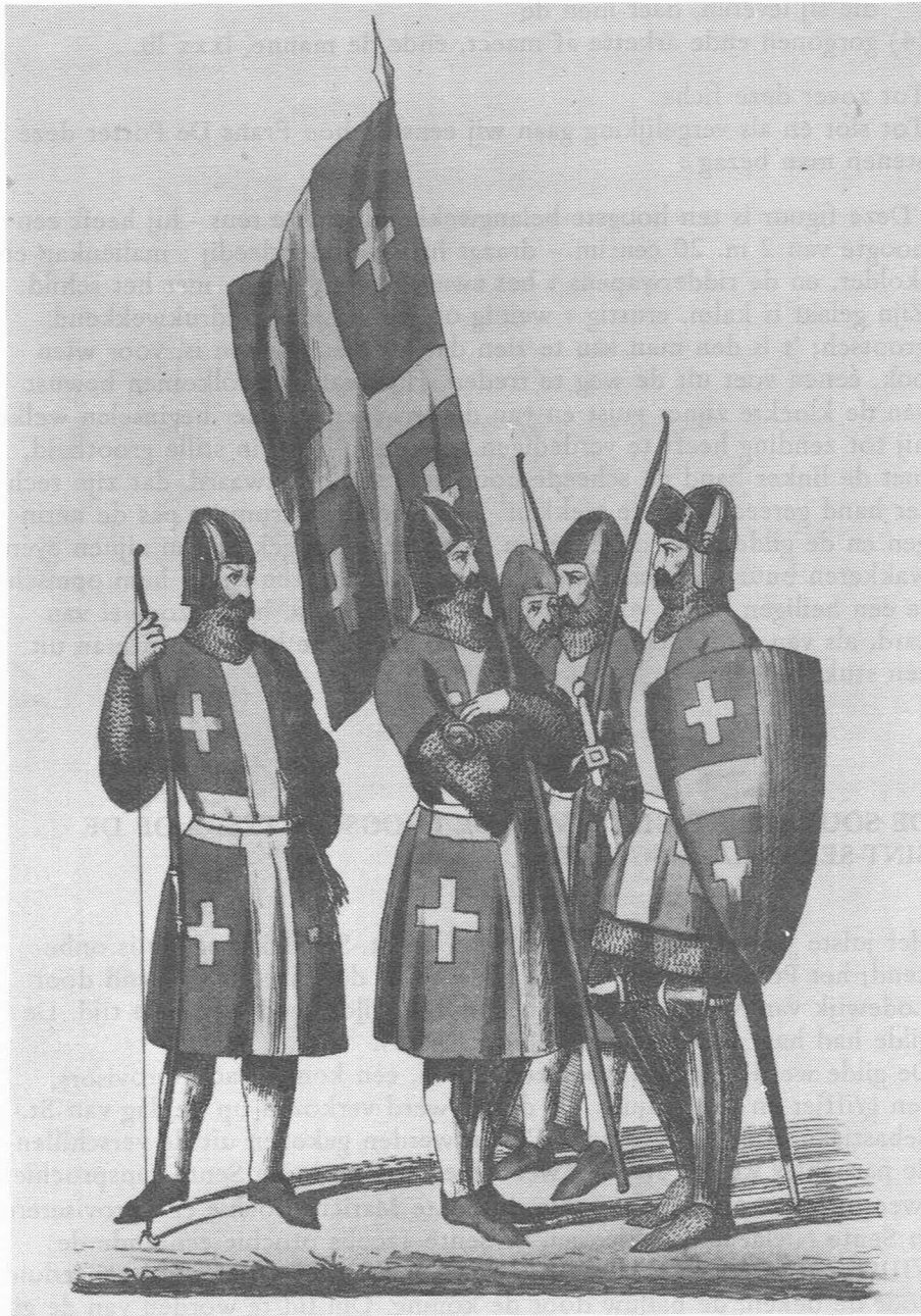
Boogschutters van het Sint-Sebastiaansgild. (Album du Cortège des Comtes de Flandre. Dessinés par Félix De Vigne)