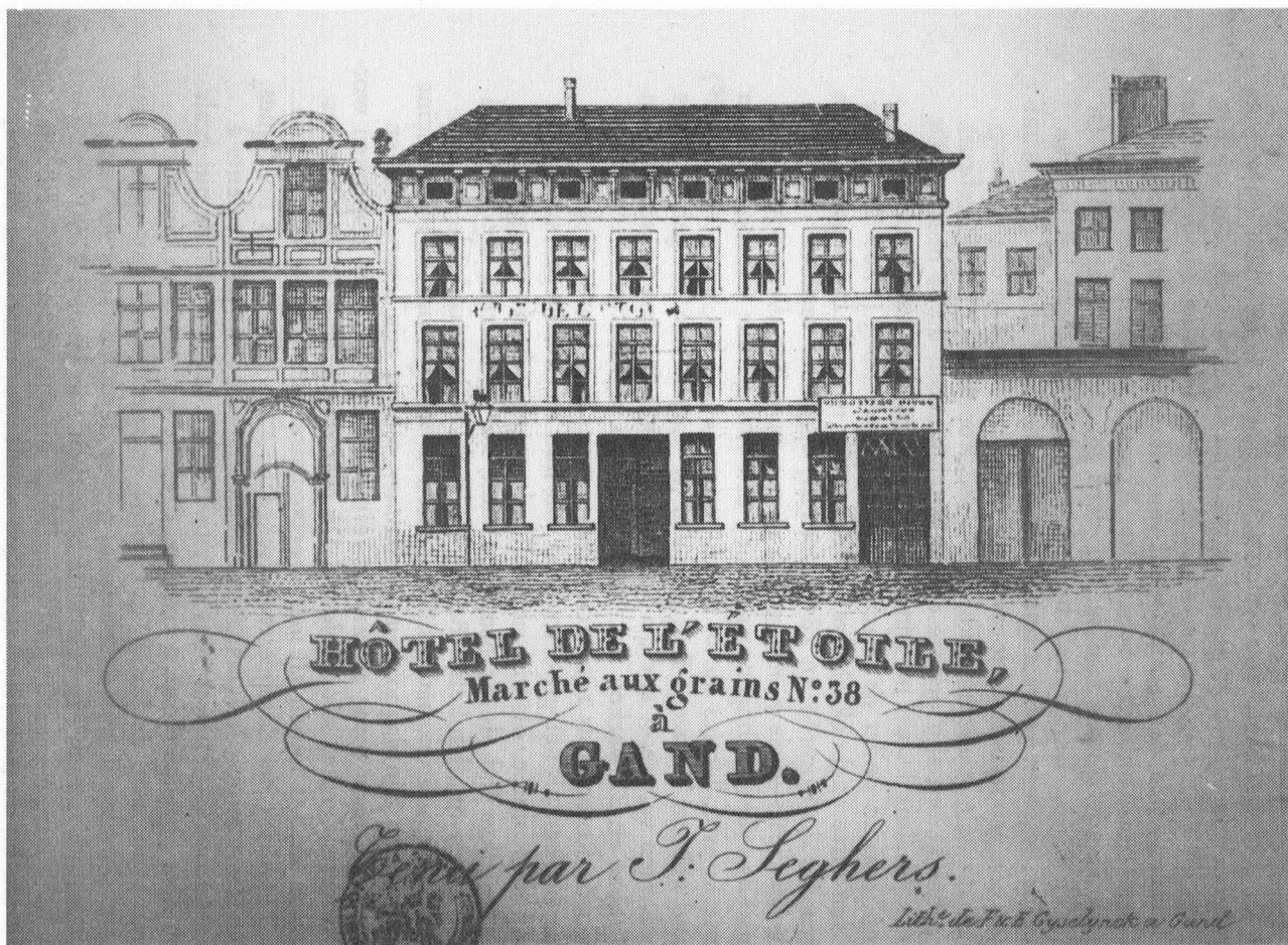
Hôtel de l'Etoile. Koornmarkt 38, Gent. (zie ook : Fr. De Potter : Gent deel 3, blz. 120). In 1893 heeft "De Ster" 28 als huisnummer.