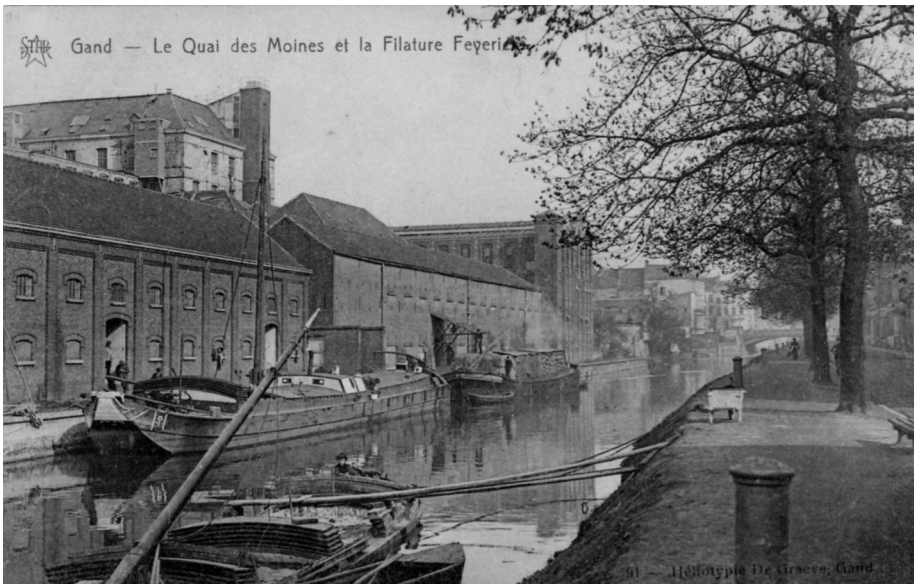
Afb. 4. In de achtergrond (boven links) van dit prachtig industrieel-archeologisch tafereel is het oude klooster, omgevormd tot Feyerick vlasspinnerij, nog duidelijk te zien (prentkaart T. De Graeve). Verz. A. Verbeke