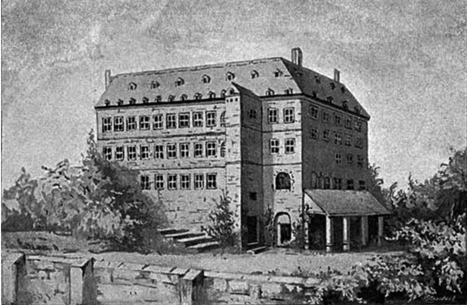
Afb. 1. Gezicht vanuit stadscentrum op het klooster (herkomst: 'Annals ...' vermeld in ref. 2). Een vergelijking met de 19de-eeuwse kadasterkaarten leert ons dat het koor van de kapel op de figuur vermoedelijk foutief gesitueerd werd. Dat lag niet in het midden van de lange vleugel, maar in de oksel met de korte vleugel bij de straat (met oriëntatie naar het oosten, zoals het hoort volgens de kerkelijke traditie).