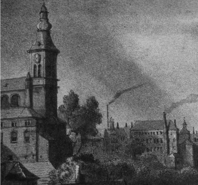
Afb. 3. Detail uit de achtergrond van een gezicht op Gent (ca. 1840; Stadsarchief Gent, Atlas Goetghebuer) vanuit het zuiden (de Muinkmeersen). Het kloostergebouw (rechts) is omgevormd tot fabrieksgebouw met rokende schouw, maar is verder nog gelijk aan wat het oudere gezicht op afb. 2 te zien geeft.