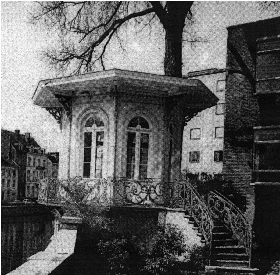
Nederkouter nr. 28 (ernaast). Tuinpaviljoen.

Sedert er vanaf de 16e eeuw thee uit het Verre Oosten werd aangevoerd door de Britse Oost-Indische Compagnie, raakte het theedrinken bij adel en burgerij in Europa snel ingeburgerd. Behalve in hun woningen gebeurde dat drin-