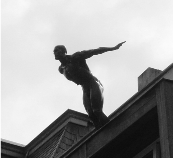
De duiker (Lindenlei).

ken ook in hun kastelen en landhuizen aan de rand van de stad, evenals in de landelijke herbergen met hovingen en paviljoenen, guinguettes genaamd, zoals o.a. 't Strop, het Patijntje, Het Motje en Het Heilig Huizeken te Drongen of andere lusthoven.